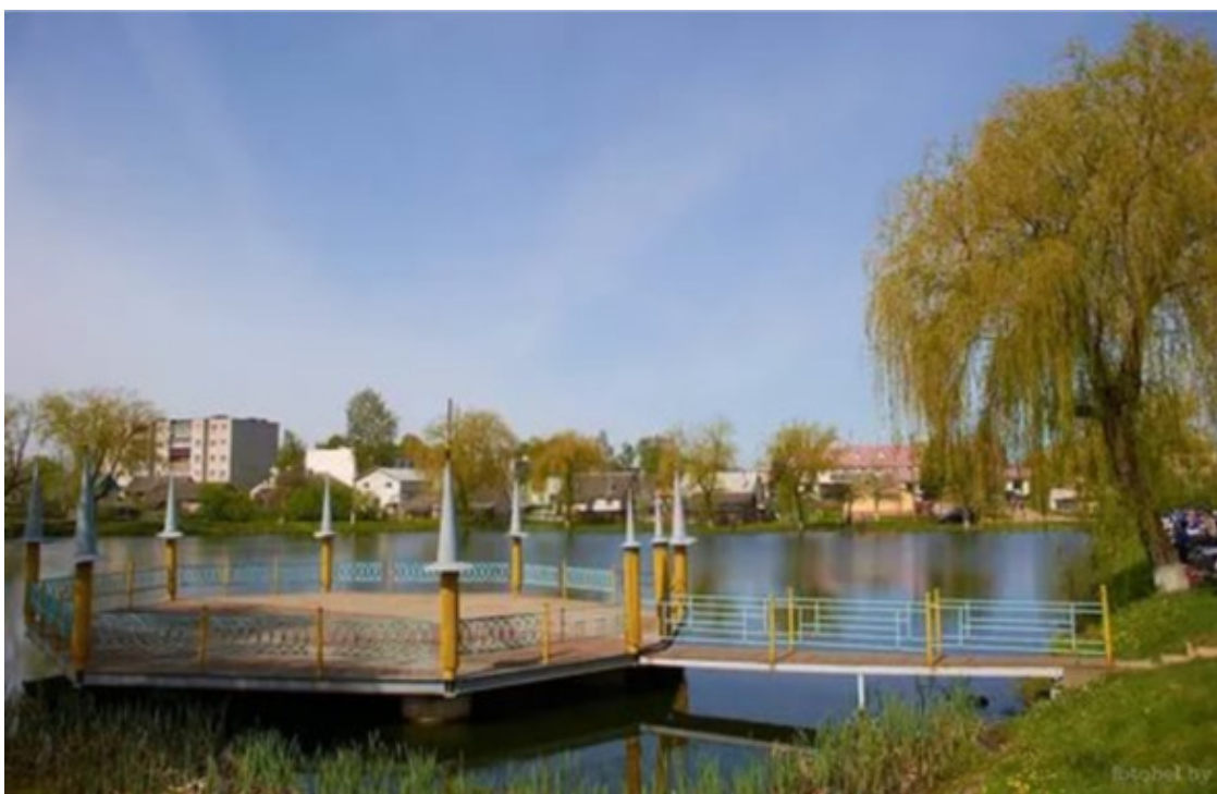
Город Клецкб, река Лань, фото.

Книга имеет образовательный и культурный характер.