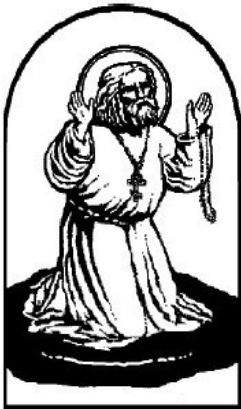
Святитель Тихон Московский (1865–1925)

Американский период жизни и деятельности святителя Тихона Московского. Документы 978-5-7868-0120-1