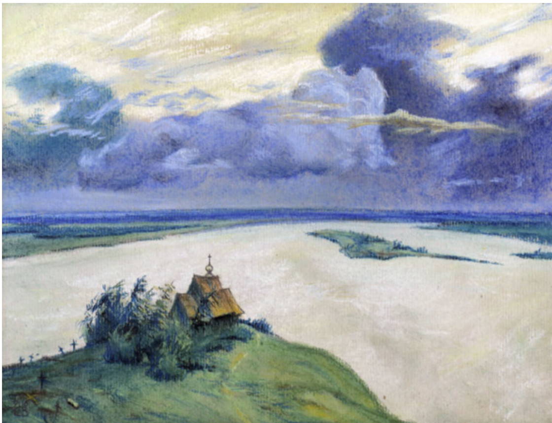
Исаак Левитан. Над вечным покоем.

Какая любовь Может быть вечной? Он сердцем искал И нашел поутру Короткий, как выстрел, Ответ бесконечный О вечной любви. ПОТЕРЯЮ – УМРУ