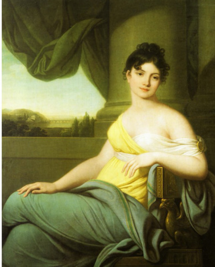
Портрет Марии Нарышкиной. Грасси. 1807 год

Быть Женщиной – особое призвание. Она не только мать или жена, Она природным женским обаяньем Наполнить сердце каждого должна.