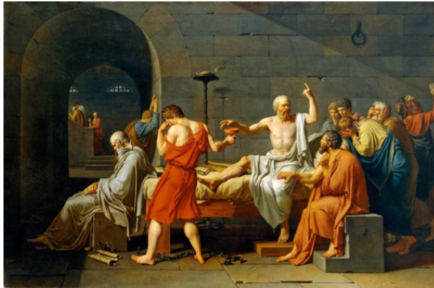
Жак-Луи Давид. Смерть Сократа

Чем чаще ты себя сумел спасти, Тем лучше ты защитой овладеешь. Тем с большей пользой в выборе пути Отличным адвокатом стать сумеешь.