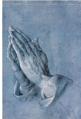
Альбрехт Дюрер. Руки молящегося