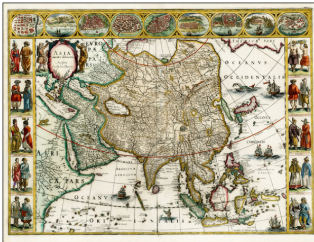
Тартария 1640 год