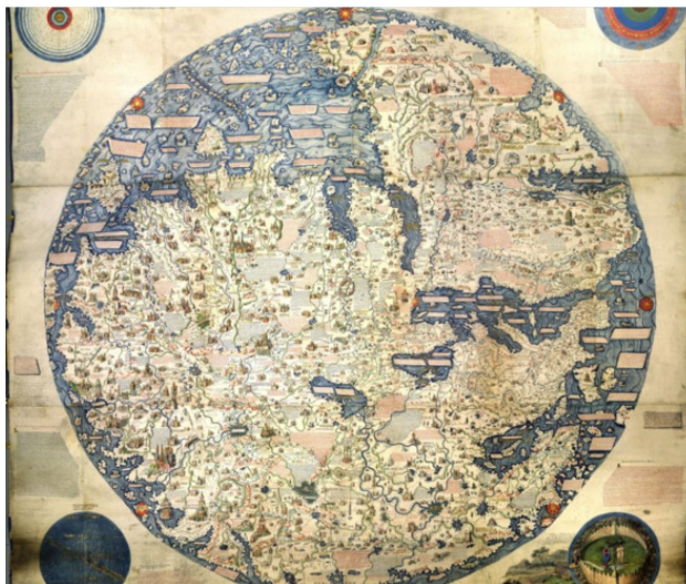
portulano (карта мира) Фра Мауро 1448 год

Новый день открыл Фатьяновым новые тайны. Свиток под номером три развернул перед ними большую карту мира, выполненную лазурью и позолотой. Голос свитка сказал: