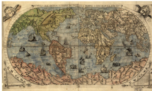
карта мира Джакомо Гастальди 1565 г.

«Несколько листов карты из атласа «Бахрийе» чудом сохранились и в 1811 году были опубликованы в Европе. Но тогда им не придали особого значения. Только в 1956 году, когда турецкий морской офицер преподнес в дар американскому морскому гидрографическому управлению карты, датированные 1513 годом, американские военные картографы провели серьёзные исследования. Их выводы стали настоящей сенсацией: «Утверждение, что нижняя часть карты показывает Берег Принцессы Марты части Земли Королевы Мод в Антарктике, а также полуостров Палмер, имеет под собой основания. Мы нашли это объяснение наиболее логичным и, возможно, корректным. Географические подробности, изображенные в нижней части карты, прекрасно согласуются с данными сейсморазведки, выполненной шведско-британской антарктической экспедицией в 1949 году сквозь толщу ледяной шапки. Это означает, что береговая линия была нанесена на карту до того, как земля Королевы Мод покрылась льдом. Лед на этой территории имеет толщину приблизительно полтора километра. У нас нет догадок, каким образом эти данные могли быть получены при предполагаемом уровне географических знаний 1513 года».