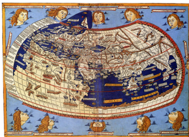
космография Николая Германуса 1482 год

При составлении этой новой карты мира mappa mundi, Мауро стремился показать то, что мореплаватели видели своими глазами, о чем рассказывали ему. Неизвестные территории он называл Terra Incognita, а для большей точности и достоверности использовал portulano Андреа Бьянко и более древние источники, датированные 1270 годом.