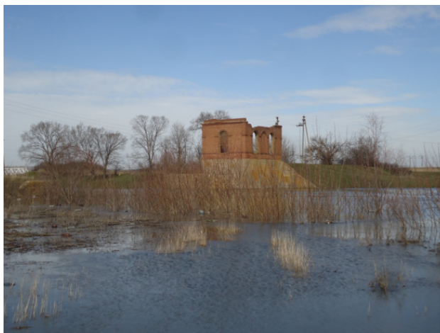
Река Миус в районе бывшей ГЭС

Нелегко на чужбине бывает порой, По весне они снова вернутся домой. По птицам красивым мы будем скучать, Клин журавлиный все выйдем встречать.