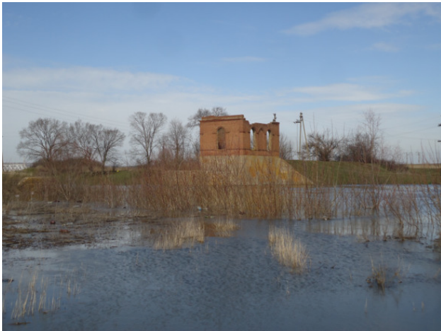
Река Миус в районе бывшей ГЭС