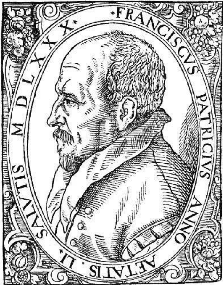
Портрет Франческо Патрици. Гравюра. Из издания: Francesco Patrizi « Discussionum Peripateticarum ». 1580 г. Ба-