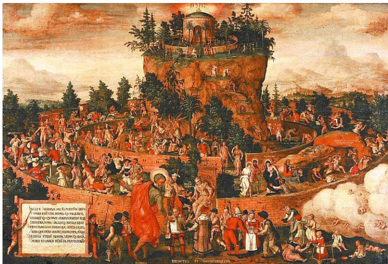
Неизвестный художник. «„Табличка“ Кебета, или Путешествие человеческой жизни». 1573 г. Рейксмузеум, Амстердам.

родителям. Названные дары не просто отдельные вещи или качества, а настоящие врачи «для поддержки (принятия) и здоровья. А если человек не послушается предписаний врача, то, разумеется, он будет выгнан и истреблен смертью». Как мы сейчас видим, экфрасис, описание воображаемой картины, не просто превращает отдельные отвлеченные понятия в олицетворенные фигуры специальными усилиями. Олицетворенным может стать все что угодно прямо по ходу повествования, с легкостью, хотя в начале повествования оно таким не было.