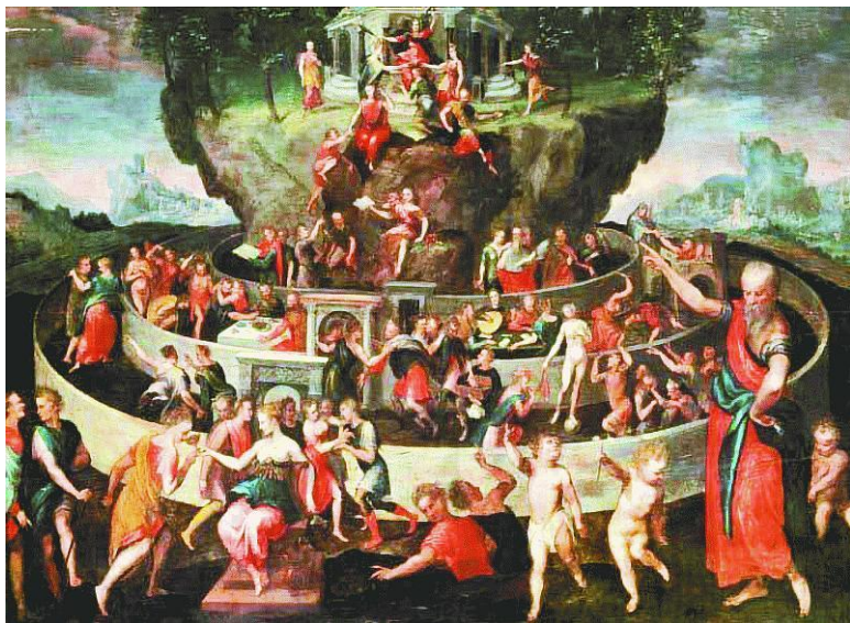
К. Варен. «„Табличка“ Кебета». Ок. 1600 г. Музей изящных искусств, Руан

Добродетели ведут праведника «к матери своей», той самой Удаче, с которой мы уже встречались. Она стоит на вершине над всеми оградами, столь возвышающейся над кручами, что к ней может вести только один путь. «Ты видишь этот путь, ведущий к самой вершине, которая и есть кремль (акрополь) над всеми этими оградами? – Вижу. – И у торжественного входа поставлена (художником) жена благовидная, сидящая на престоле высоком, украшенная свободно (т. е. в духе свободных людей, по моде) и изысканно, увен-