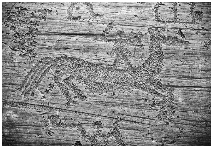
Изображения в долине Валь-Камоника

В Италии на территории долины Валь-Камоника на скалах и каменных глыбах сохранилось около 300 тысяч изображений: дома, животные, люди и... существа в костюмах, напоминающих космические. Эти фигуры кажутся парящими. Местные жители называют их «воинами Камоники». Современный человек, взглянув на такую картинку, сразу скажет, что это космонавты. Но рисункам в долине Валь-Камоника 5—10 тысяч лет! По нашим представлениям, в те стародавние времена не могло быть космонавтов. История утверждает: человеческая цивилизация тогда только зарождалась. Это наталкивает на мысль, что древние люди не просто придумали, а срисовали «всевышних богов» с натуры.