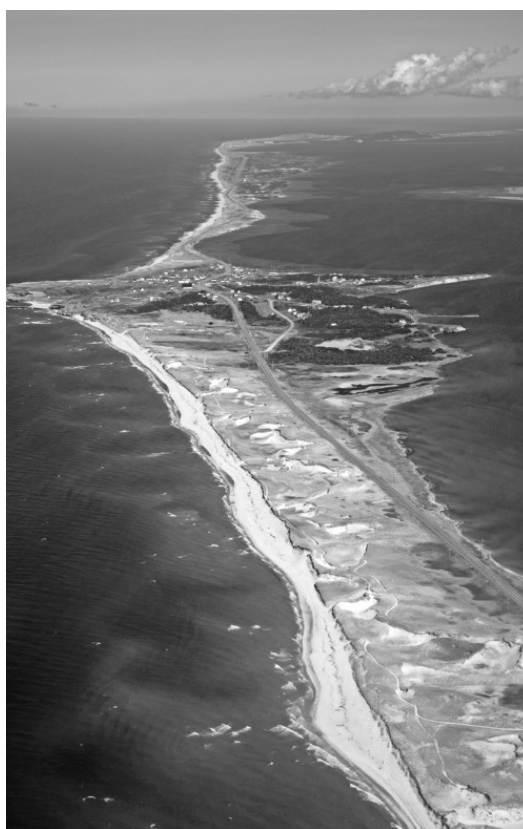
Кочующий остров Сейбл

Чтобы ответить на все вопросы, американские и канадские ученые решили исследовать геологическое строение острова и выяснить, почему он постоянно дрейфует. Ведь по законам геологии это невозможно. Любой остров – это вершина подводной горы. А основание этой горы соединено с одной из гигантских тектонических плит. Получается, что остров может подвинуться ровно на столько, на сколько сдвинулась вся плита. Средняя скорость движения тектонических плит – 2—4 миллиметра в год. Но Сейбл сдвигается в 100 тысяч раз быстрее! Как такое возможно? Чем это объяснить? Вот тут-то и была выдвинута сенсационная гипотеза – остров Сейбл гигантское живое существо!