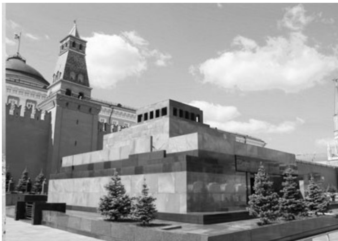
Древнешумерский зиккурат и мавзолей Ленина