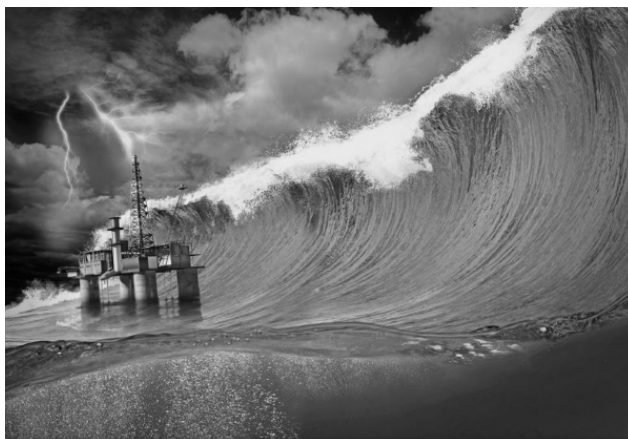
Волна-убийца обрушивается на нефтяную платформу

Согласно одной из научных гипотез, причиной массовых самоубийств моряков являются гигантские волны-шатуны, которые по неизвестной причине возникают в открытом океане и внезапно набрасываются на суда.