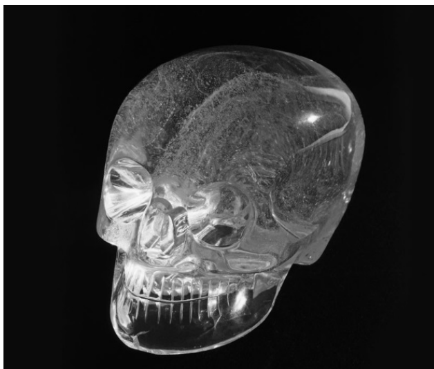
Хрустальный череп, найденный экспедицией профессора Митчелла-Хеджеса

Но неужели у древних людей было какое-то подобие современных компьютеров или вычислительных устройств? Вот убедительное доказательство в пользу этой идеи.