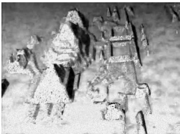
Город пирамид у побережья Кубы

Отто Мук стал сверять данные современной геологии с записями Платона об Атлантиде и нашел множество совпадений. Все это так увлекло инженера, что результаты своего труда он изложил в книге. Там подробно описана гибель Атлантиды, и эта версия считается наиболее правдоподобной.