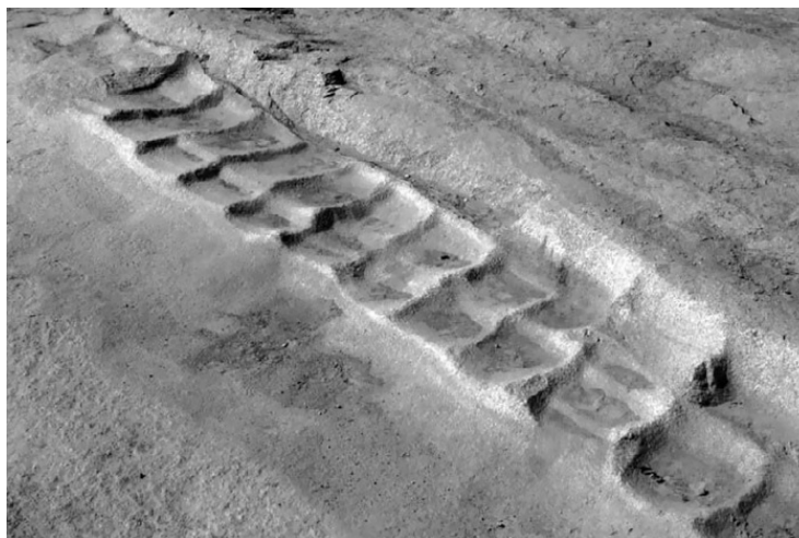
Борозды от вынутых камней в асуанских каменоломнях

Но как древние строители их высекли и привезли на место?