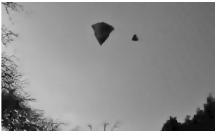
Пирамидальные инопланетные корабли стали прообразом египетских пирамид

По версии Хабека и ряда других ученых, золотые птицы из гробниц, древние пирамиды, напоминающие космические корабли, летающие тарелки, любовно вырезанные в далеком прошлом из камня, – это не что иное, как имитация того, что видели древние люди.