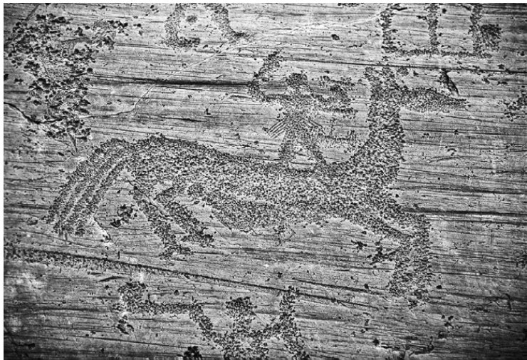
Изображения в долине Валь-Камоника

менный человек, взглянув на такую картинку, сразу скажет, что это космонавты. Но рисункам в долине Валь-Камоника 5—10 тысяч лет! По нашим представлениям, в те стародавние времена не могло быть космонавтов. История утверждает: человеческая цивилизация тогда только зарождалась. Это наталкивает на мысль, что древние люди не просто придумали, а рисовали «всевышних богов» с натуры.