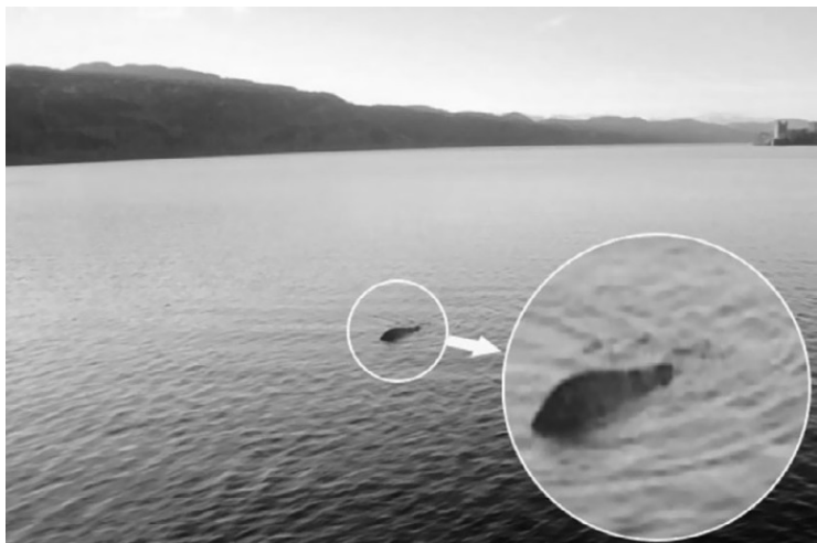
Фотография Лох-Несского чудовища, сделанная капитаном прогулочного судна Джорджем Эдвардсом

Одно из самых загадочных мест на земле – руины древнего персидского города Пасаргады, расположенного на территории современного Ирана.