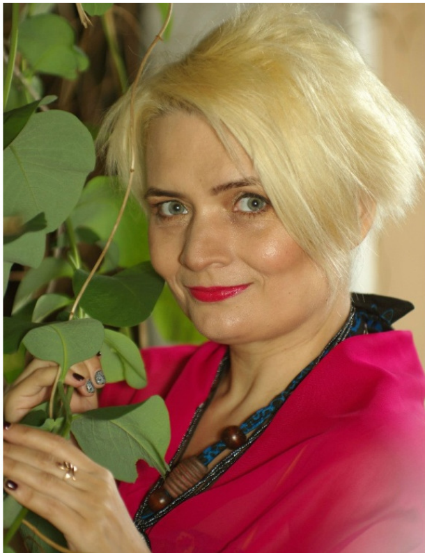
Организатор фестиваля, председатель жюри