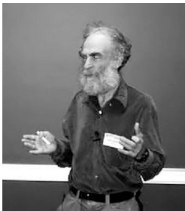
Громов Михаил Леонидович