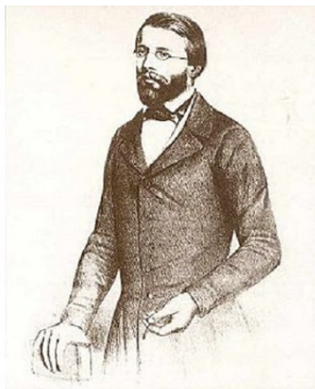
Bernhard Riemann (1826—1866)