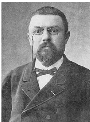
Henri Poincaré (1854—1912)