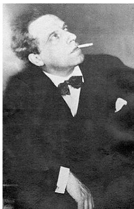
Всеволод Мейерхольд (1874—1940)