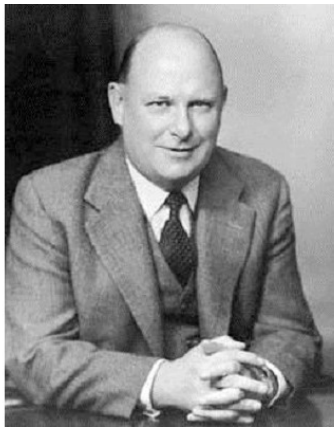
William Hodge (1903—1975)