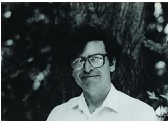
William Thurston (1946 – 2012)