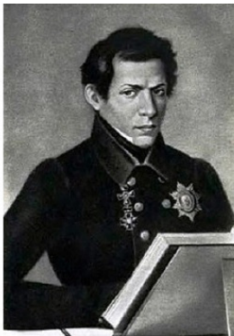
Лобачевский Н. (1792—1856)