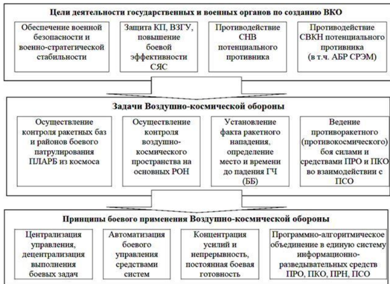
Рис. 1. Роль и место ВКО в обеспечении военной безопасности (концепции стабильности сдерживания)

Как следствие противоборства двух общественно-политических систем сложился военно-стратегический баланс, представляющий форму выражения соотношения качественных и количественных показателей сил двух сторон и фактов, определявших стратегическую ситуацию. Их совокупность представляет собой сложную динамическую макросистему, главным элементом которой являются стратегические ядерные силы и стратегические оборонитель-