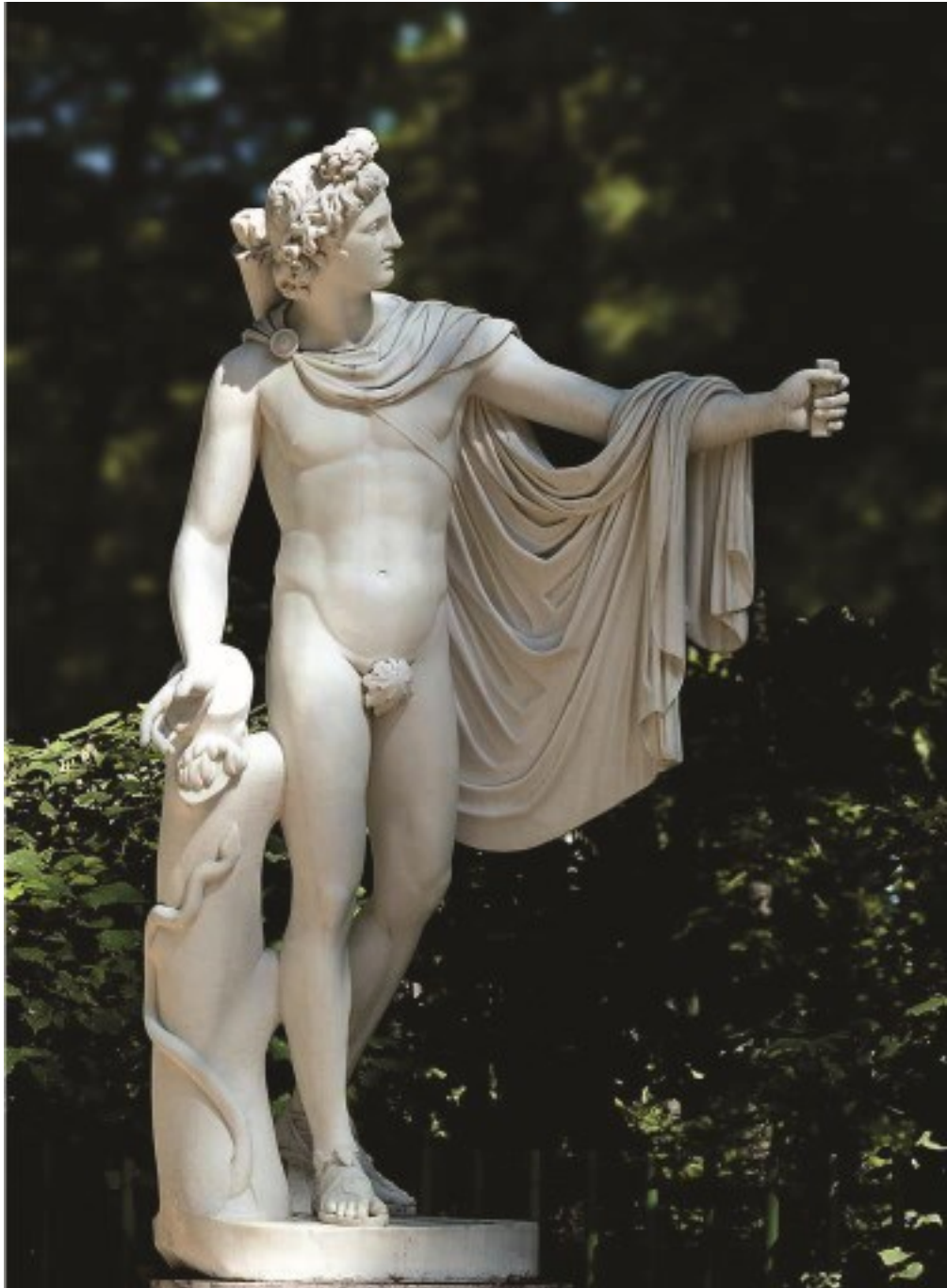
Рис. 7. Аполлон Бельведерский. Мраморная копия бронзовой статуи Леохара, выполненная ок. 330 в. до н. э., Ватикан.

Это боги старшего поколения, боги природных и внутренних для человека стихий, но уже отчасти усмиренных, окультуренных. Младшие олимпийцы – дети Зевса связаны уже не непосредственно с природой, но с разными сторонами развивающейся культуры.