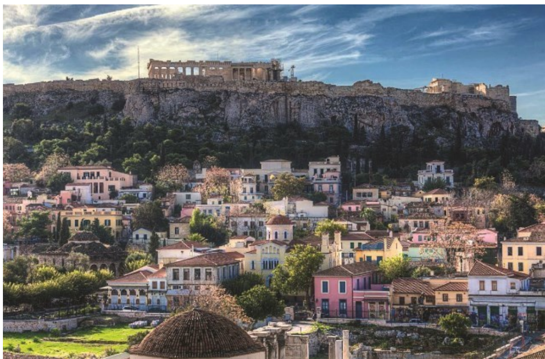
Рис. 4. Афины. Вид на Акрополь