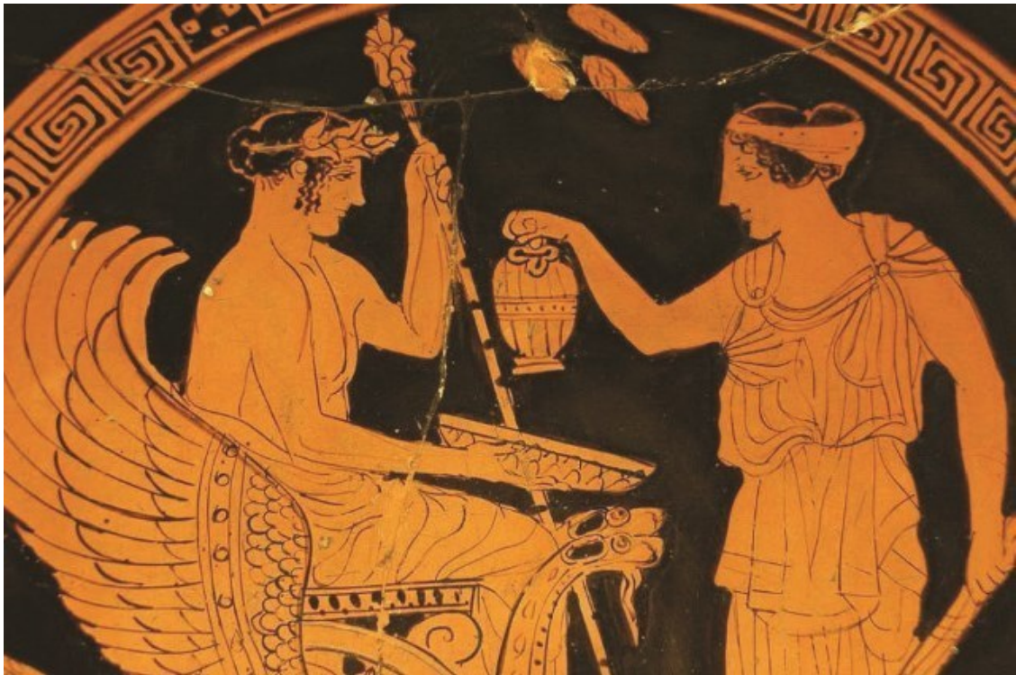
Рис. 2 Деметра вручает Триптолему семена для первого посева. Вазовая краснофигурная живопись. Греция. V в. до н. э.

Этому союзу посвящено стихотворение Шиллера «Элевсинский праздник», переведенное на русский язык Василием Жуковским и цитируемое Достоевским в романе «Братья Карамазовы». Часть урожая приносится в жертву, сжигается, выбрасывается. Жертва-самоограничение. Человек знает, что часть своего он должен отдать Богу. Жертва не бессмысленное, но даже необходимое действие. Способность жертвовать – лучшая часть сущности человека.