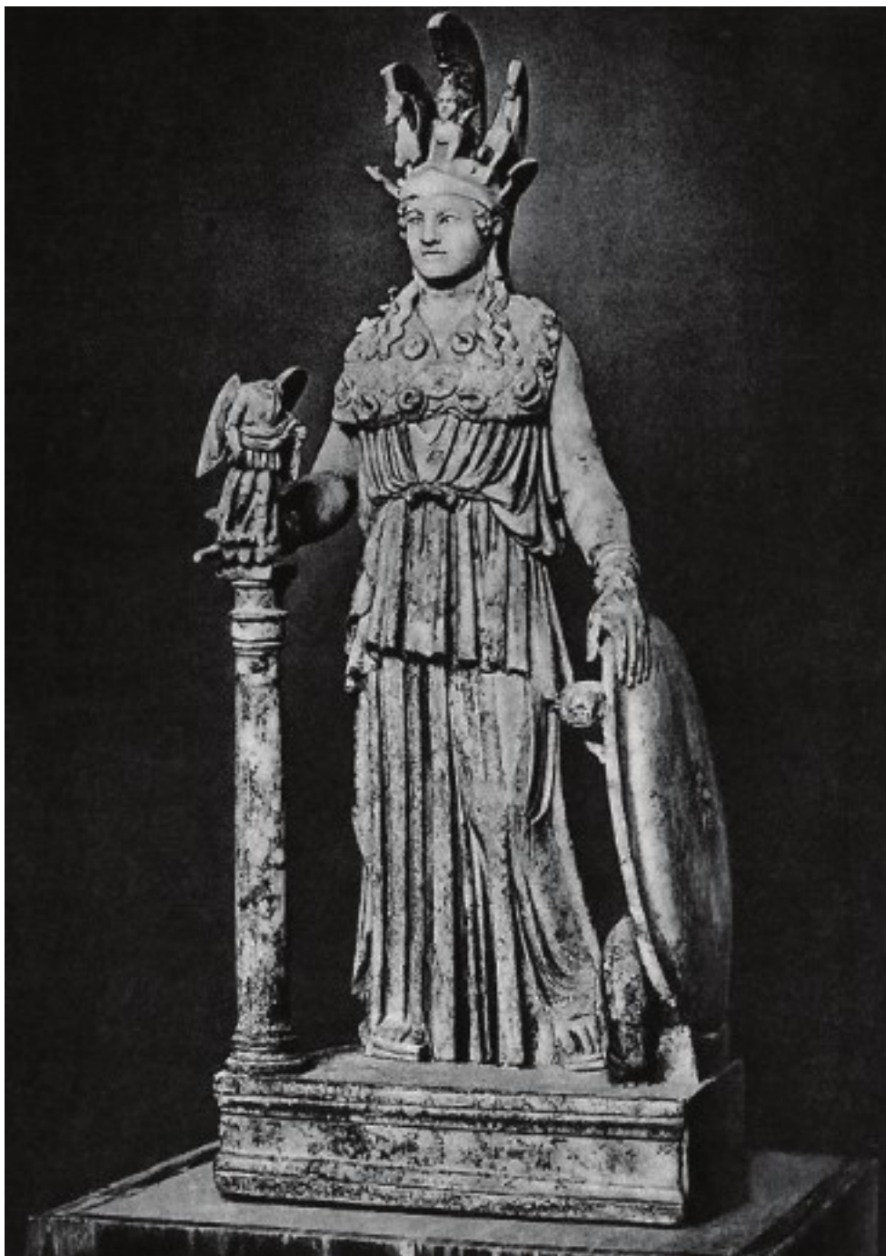
Рис. 8. Афина-Парфенос (Дева) Филлий. Ок. 490—430 гг. до н. э. Античная копия. Национальный музей. Афины