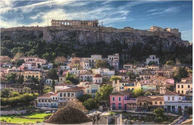
Рис. 4. Афины. Вид на Акрополь

в., когда в мужских гимназиях было введено изучение латинского и греческого языков. Греческая культура стала синонимом культуры вообще.