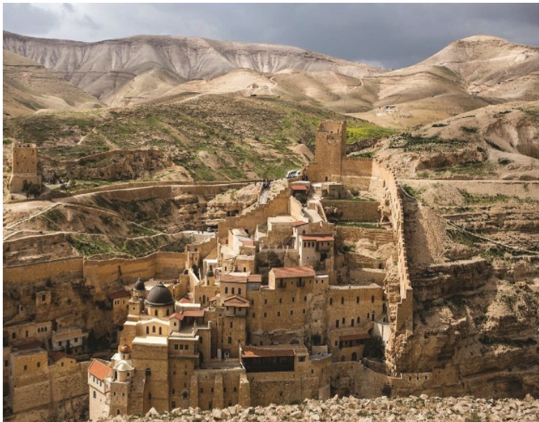
Рис. 3 Иерусалим. Старый город

2. Литература и искусство Древней Греции. Древняя Греция – колыбель собственно европейской культуры. Культура Древней Греции, имевшая своим главным центром город-государство Афины, – часть античной культуры, включающей в себя греческую и римскую. Но римская культура построена на греческой. Европейскую культуру периодически охватывает любовь к Древней Греции. Особенно это касается Германии конца XVIII – начала XIX в. Это время Гете, Шиллера, Гумбольдта. Оно во многом повлияло и на Россию XIX