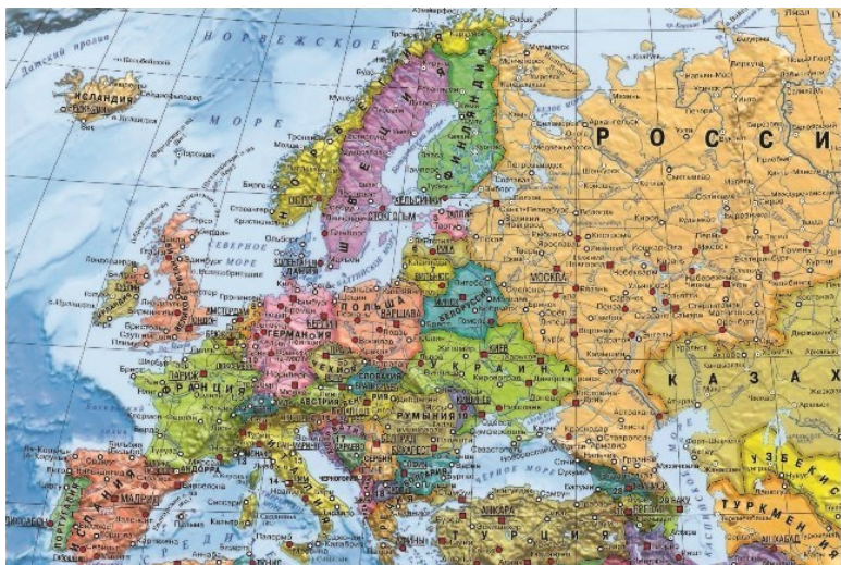
Рис. 1 Карта Европы

Другой путь связан с образованием человека. В процессе образования человек должен созидать самого себя. Это не профессиональное образование. Здесь важно изучение созданной веками культуры, что всегда способствует улучшению нравов и нравственности. Но этого можно достигнуть только в процессе тяжелой внутренней работы. Здесь онтогенез (развитие организма) повторяет филогенез (общее развитие), который совершается в процессе истории. Самый естественный путь для непрофессионала – путь путешествия по истории культуры, в данном случае культуры Западной Европы. Этот путь субъективный. Выбирается то, что кажет-