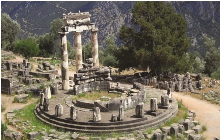
Рис. 5 Дельфы. Святилище Аполлона. VI в. до н. э.

О богах и людях мы узнаем из разных источников, но больше всего из произведений Гомера. Поэмы Гомера «Илиада» и «Одиссея» – важнейшие книги всей европейской литературы. Гомер до сих пор справедливо считается величайшим из поэтов, «кумиром тридцати веков». Его сочинения, созданные в VIII в. до н.э., продолжают вызывать общее восхищение. Физическая слепота придавала ему особую способность духовного зрения и прозрения. В VI веке до н.э. слава Гомера распространялась на всю Грецию. Афинский тиран Писистрат, современник великого законодателя Солона, приказал сделать первую запись знаменитых