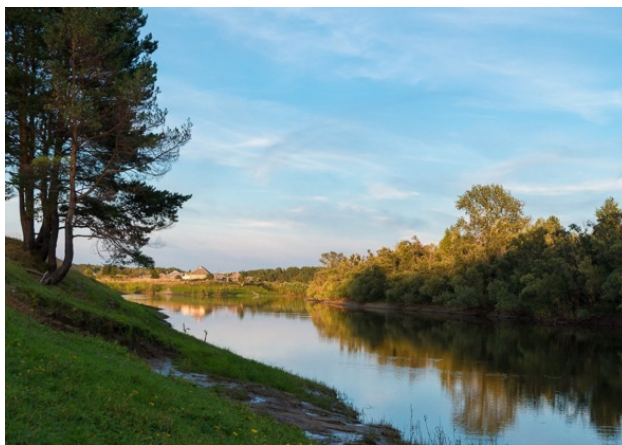
Река Туй. Тевризский район. Омская область.

А друг увидит... Если что, подскажет, Когда я не замечу, не взгляну. Кивнёт слегка или напомнит даже: – Ты что? Не спи! Уже пора тянуть.