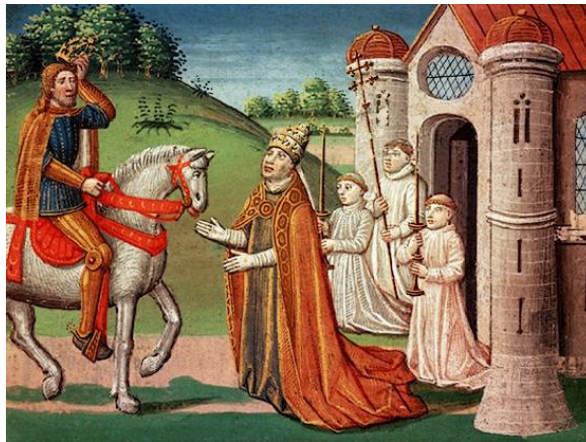
Карл Великий и Римский Папа Адриан I

По мнению одних историков, силы франков и арабов были равны. Но как часто это бывает, другие историки считают, что у арабов был перевес в силах, а численность армии франков составляла \frac{3}{8} от сил врага. Те историки, которые говорят, что сил было поровну, оценивают армию Карла Мартелла в 20 тысяч, а их оппоненты считают, что франков было на 50% больше. Какая максимальная численность армии арабов?