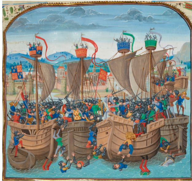
Битва при Слейсе. Миниатюра из «Хроник» Жана Фруассара.