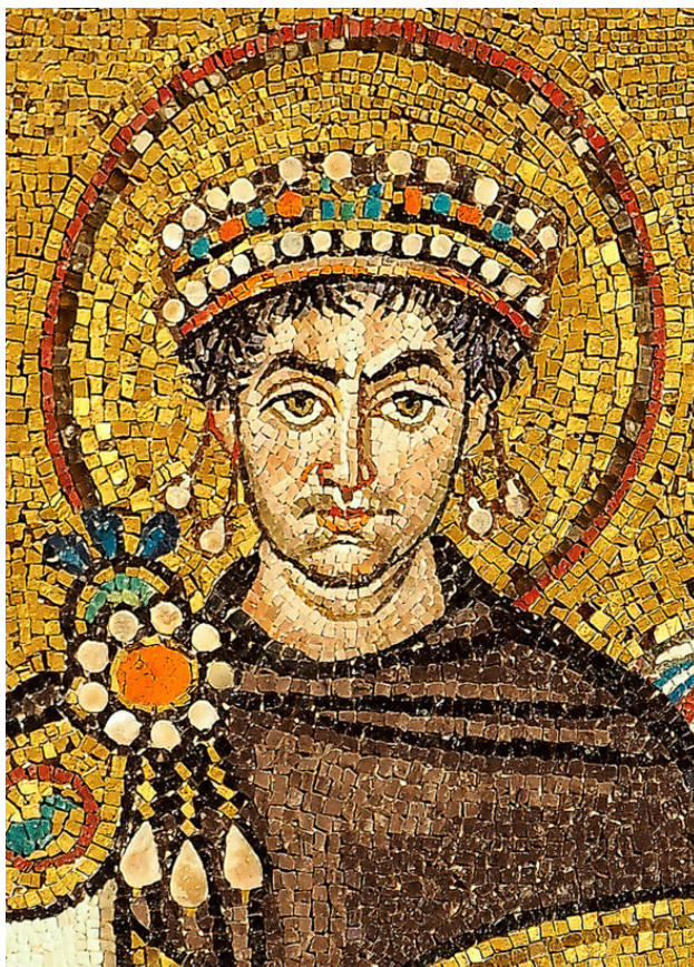
Император Юстиниан. Мозаика церкви Сан-Витале в Равенне

Когда император вззошел на престол, если датой создания Византийской империи считают 395 год?