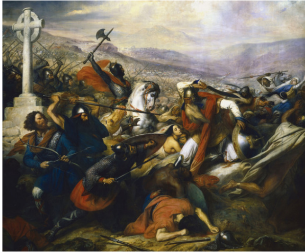
Карл Штейбен. Битва при Пуатье 732 год.