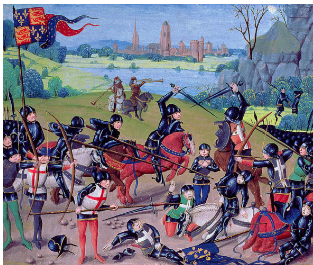
Битва при Азенкуре. Миниатюра 15 века.