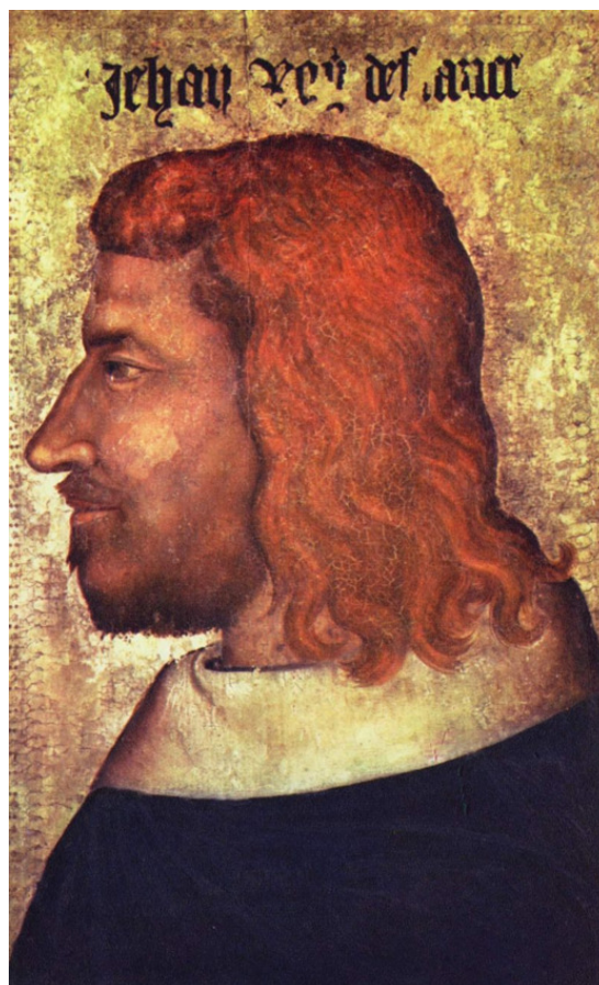
Король Иоанн II (Добрый).