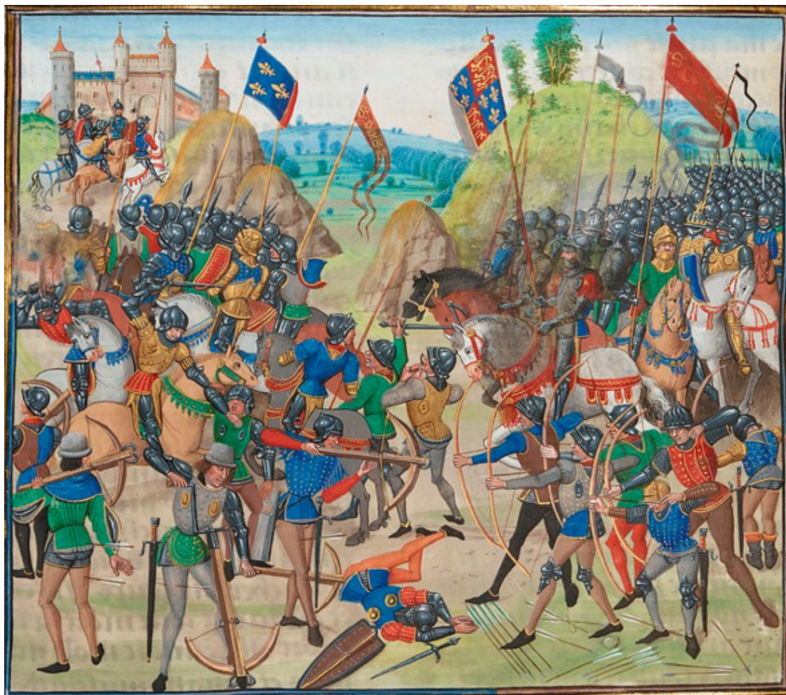
Битва при Креси. Миниатюра из «Хроник» Жана Фруассара