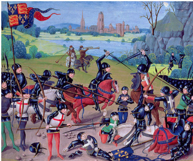
Битва при Азенкуре. Миниатюра 15 века.