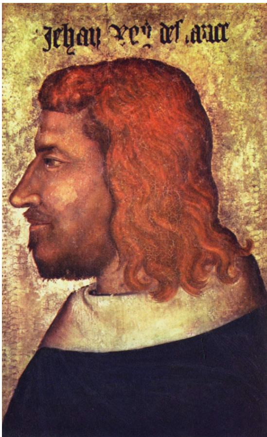
Король Иоанн II (Добрый).