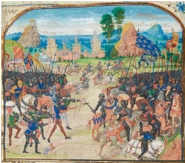
Битва при Пуатье (1356 г.) Средневековая миниатюра.