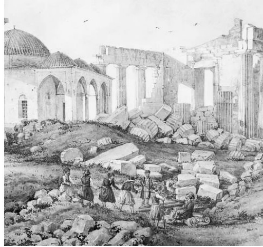
Так выглядел Парфенон в XIX в.

С точки зрения физики энтропия этой системы была близка к максимальной: все, что можно было разрушить, было разрушено. А информация, содержащаяся в беспорядочном нагромождении обломков, была почти нулевой. Кто мог разглядеть в этой куче прекраснейшее творение гениального Калликрата?