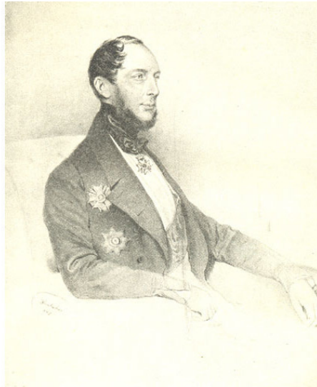
Луи-Якоб-Теодор Барон ван Геккерн де Беверваард