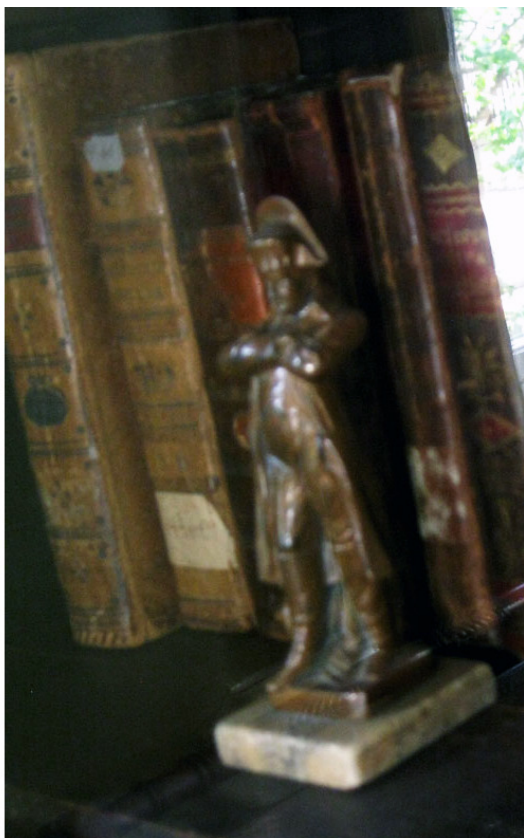
Фигурка Наполеона в книжном шкафу Пушкина

За стеклом запертой на ключ дверцы покоилась небольшая, высотой с книгу, бронзовая фигурка Наполеона в характерной позе: со скрещенными на груди руками и задумчиво опущенной головой.