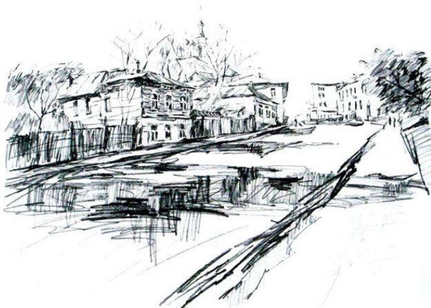
Рисунок Д. Сажнова