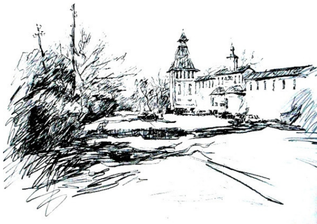
Рисунок Д. Сажнова