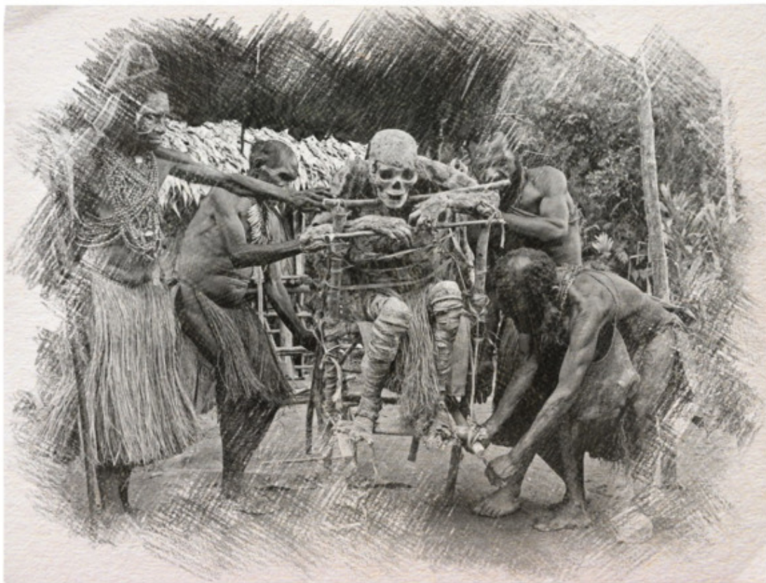
Ритуал «фамадихана» на Мадагаскаре

Наиболее эффектным обычаем почитания мертвых является обряд « фамадихана », проводимый каждую зиму на Мадагаскаре. Обряд состоит в том, деревенские жители вскрывают могилы, достают оттуда тела своих умерших родственников, очищают их и наряжают в новые шелковые одежды. В таком виде умерших под звуки музыки носят по деревне. Мертвецов усаживают на почетные места, предлагают еду и напитки, и отчитываются перед ними о событиях, произошедших за год. А потом столь же торжественно относят на кладбище и захоранивают до следующего раза. Понятно, что такие обряды и столь подробные представления о загробном мире не могли возникнуть, если бы не рассказы вернувшихся оттуда.