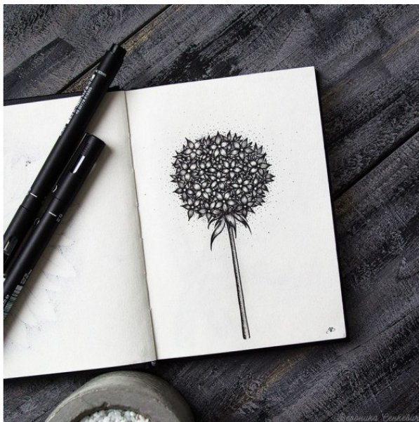
Графика Вероники Сенкевич