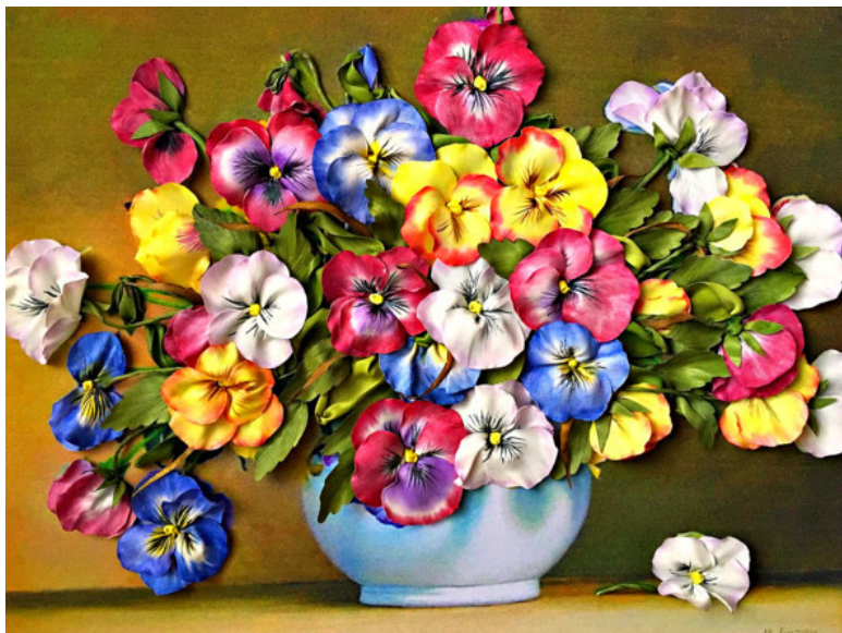
Работы Елены Мерцаловой, выполненные лентами.