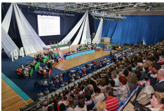
«Хватит пиара! Верните наши деньги!» – скандировали жители Серпуховского района в ДС «Надежда», высказываясь против политики губернатора А.Ю.Воробьёва