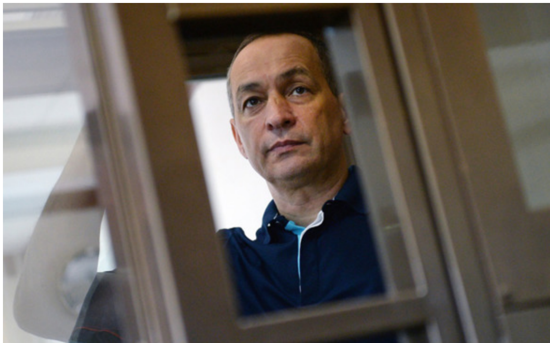
Александр Шестун на апелляции по избранию меры пресечения в Мосгорсуде 27 июня 2018 года