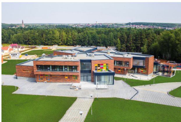
Уникальная для России школа-интернат «Абсолют» в селе Райсемёновское