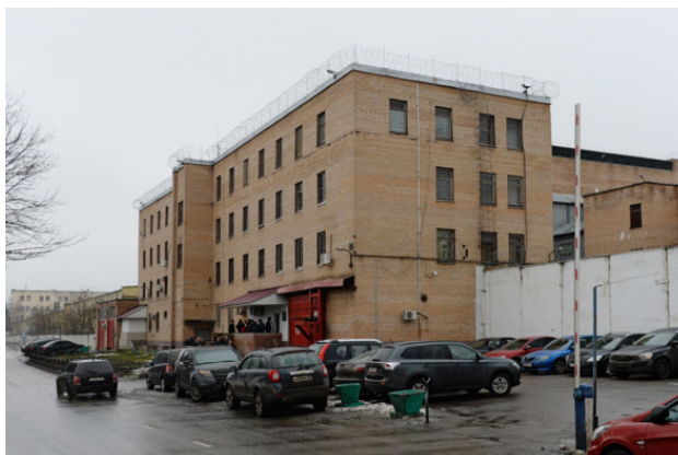
СИЗО-5 «Водник» УФСИН России по г. Москва