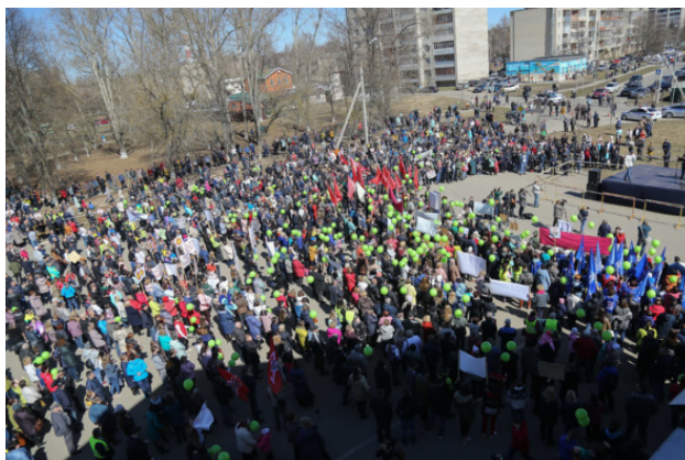
Самый крупный митинг против полигона ТКО «Лесная» в посёлке Большевик, 18 апреля 2018 года