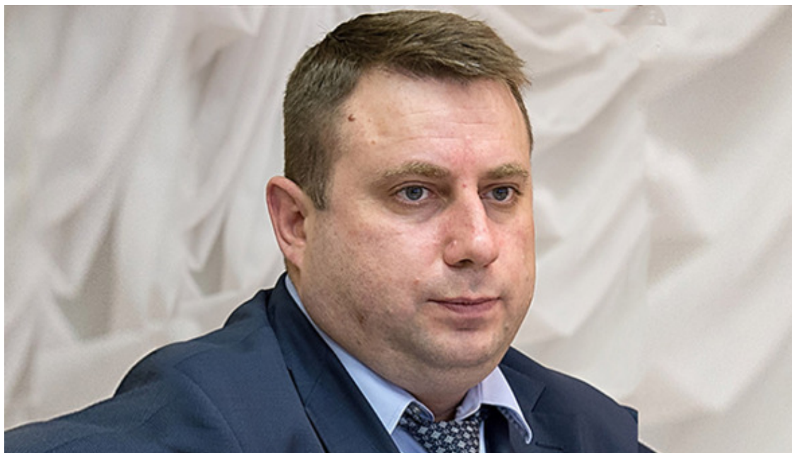
Глава города Серпухова Дмитрий Жариков, ставленник Подольской группировки и губернатора Московской области