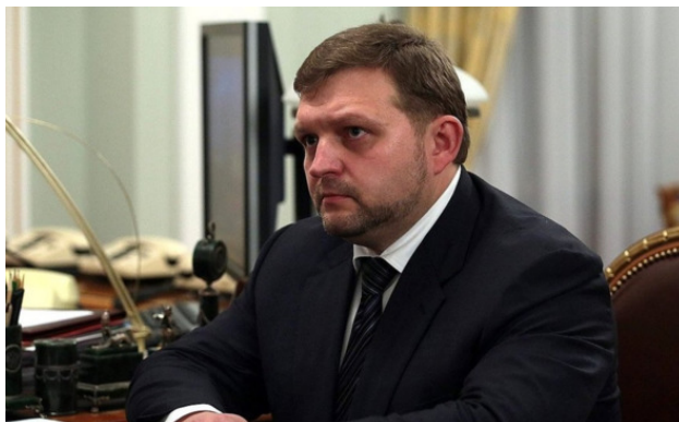
Экс-губернатор Кировской области Никита Белых

В этой же камере сидел губернатор Кировской области Никита Белых, что с его огромным ростом и весом очень непросто. Он уехал на зону в Рязань, где сейчас занимается заготовкой сена. Рассказывают, что его здесь никто не любил, в первую очередь персонал СИЗО. Белых никак не мог выйти из образа губернатора, очень много жаловался, разговаривал со всеми как с подчинёнными, и руководство СИЗО слило его в камеры с узбеками и таджиками, сидевшими по статье «Терроризм». Но надо сказать, что Белых вёл себя прилично, никого не сдал, вину не признал. Он большой и с большим духом, администрация СИЗО издевалась над ним, не давая лечения, а ведь он сидел с опухшей ногой и с первым типом диабета – на инсулине.