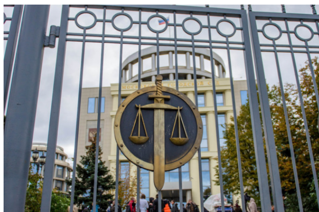
Здание Московского городского суда

Очень много узбеков и таджиков – не меньше половины, и они самые оптимистичные. Познакомился с русским 50-летним мужчиной из Москвы, обычный работяга, трудится наладчиком жалюзи для магазинов, а обвиняют его по статье «Терроризм». Рассказывает, что дважды со знакомым был на посиделках секты «Аум синрикё» в обычной квартире, где участвовало три-четыре человека. Вроде как в дискуссиях участия не принимал, а только готовил еду. Теперь ему грозит срок от 15 лет. Когда слышишь такое, автоматически тебе становится легче, и твоя несправедливость по сравнению с его становится мелкой и незначительной.