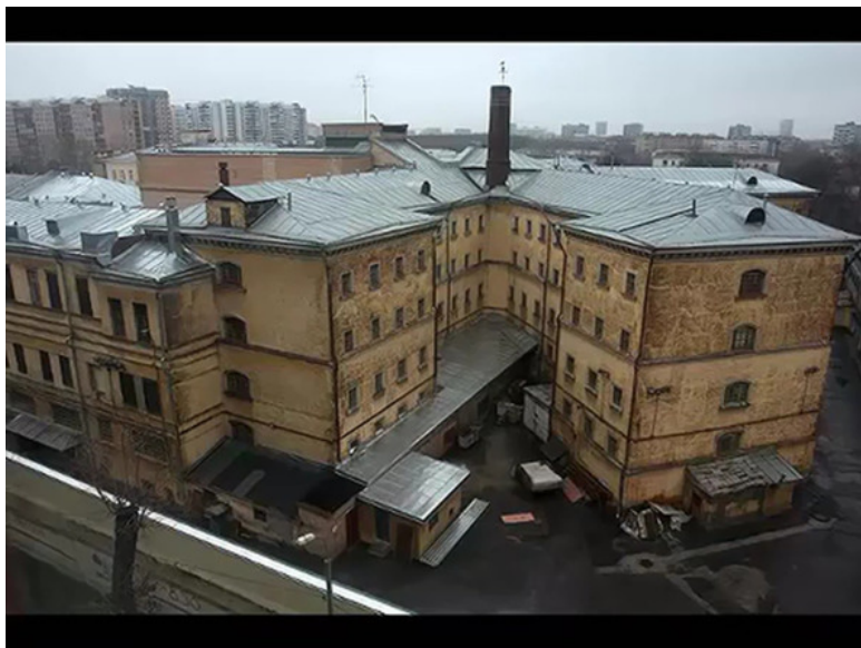
СИЗО-2 ФСИН России «Лефортово»

что если я так активно буду заниматься своей защитой, общением с правозащитниками, жалобами, публикациями в СМИ, то меня отправят в «Лефортово», а там даже увидеться с адвокатами очень проблематично, словом, рисовали все ужасы. Но моё падение всё ниже и ниже я уже не мог остановить, иначе это был бы уже не я. Ко всему прочему, много ведущих политиков России называли моё уголовное дело политическим, так почему тогда не «Лефортово», рассуждал я про себя.