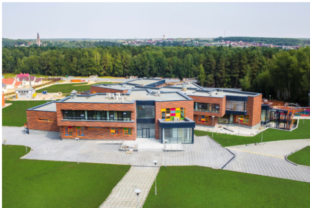
Уникальная для России школа-интернат «Абсолют» в селе Райсемёновское