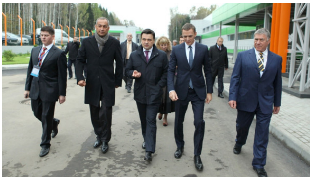
Александр Шестун с губернатором Московской области Андреем Воробьёвым на открытии инсулинового завода «Герофарм-Био» в посёлке Оболенск, 2013 года