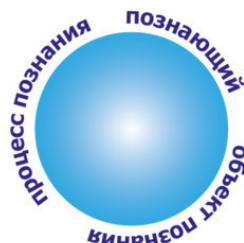
Рис. 2.1 Цельность процесса познания

Рис. 2.1 В любом творческом или рабочем процессе всегда присутствуют три компонента: познающий, предмет изучения и процесс познания. В более высоком состоянии сознания представляется возможным слияние этих частей в одно целое. Возможность достижения этого состояния человеком является целью Вед.