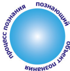
Рис. 2.1 В любом творческом или рабочем процессе всегда присутствуют три компонента: познающий, предмет изучения и процесс познания. В более высоком состоянии сознания представляется возможным слияние этих частей в одно целое. Возможность достижения этого состояния человеком является целью Вед.

Как же осознать феномен целостности сознания? Прежде всего надо помнить, что мы — изначально духовные существа и наша настоящая природа — это чистое и спокойное сознание, которое лежит за пределами самых тонких мыслей и эмоций. Мы все связаны с единым энергетическим и разумным полем, которое незримо существует внутри любого из нас. Как только мы начинаем это осознавать и подмечать, то мы видим, что кроме видимого материального мира мы можем ощущать внутри себя незримое присутствие, обладающее мощным потенциалом безусловной любви и счастья. Как только человеку удастся осознать это присутствие,