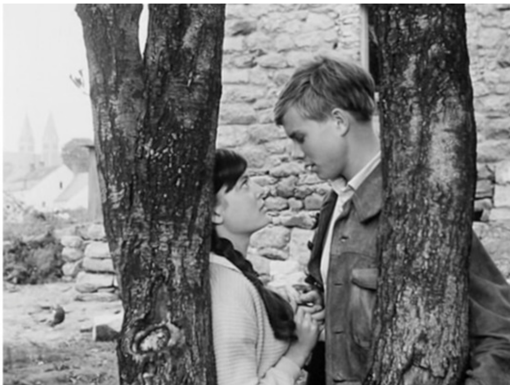
Кадр из немецкого антивоенного фильма «Die Brücke», 1959