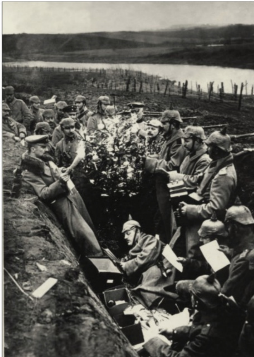
Рождество на восточном фронте, 1914

laß den Krieg den andern, laß, eh wir verhungert sind, friedlich heim uns wandern. Liegst du erst im Massengrab ist es völlig schnuppe ob du einen Zug geführt oder eine Gruppe und ob du ganz alleine fällst oder in der Rotte ach das ändert alles nichts an dem Heldentotte.