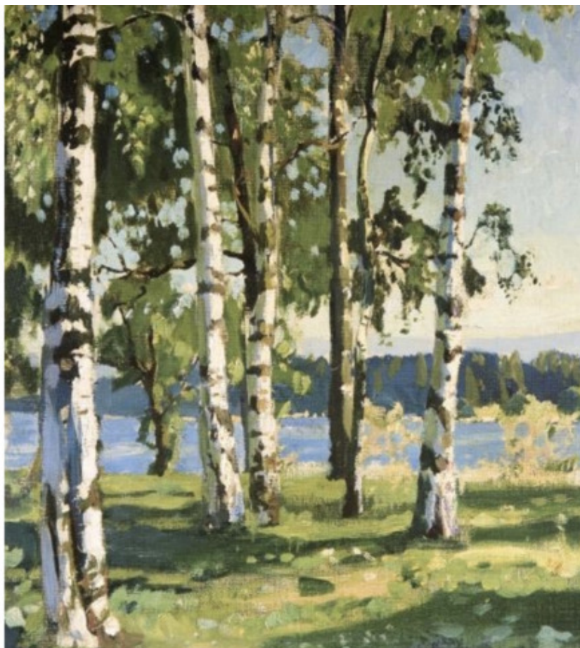
А. А. Рылов (1870—1939). Березы. 1916.