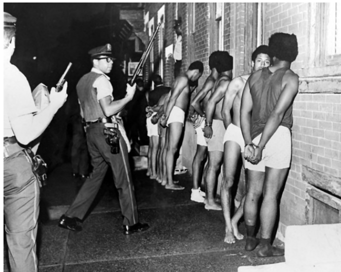
После утреннего рейда полиции в одну из штаб-квартир Черных пантер. Август 1970 г.

Разве это могло помешать расцвету «Черных пантер»? Напротив. Как ни жестоко это звучит, эти перестрелки лишь помогали в создании имиджа великомучеников за права народа.