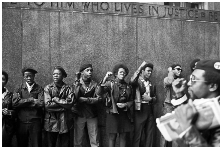
Партия Черных пантер на акции протеста в Нью-Йорке. 1969 год.

Пару раз заучек и выскочек Хьюи Ньютона и Бобби Сила били местные, но чаще все же они сами попадают в полицейский участок и проводят ночь в обществе бродяг просто за то, что в очередной раз попались на глаза патрульных. Как и в любом гетто, тут то и дело полицейские убивают кого-то из местных жителей. Стоит сказать все же, что в большинстве случаев это происходит в тех случаях, когда какой-нибудь наркоторговец или наркоман решает сбежать с места преступления, но случаются и фатальные ошибки, когда человека расстреливают просто так, в качестве превентивной меры. Все это происходит на глазах у местных жителей, и все понимают, что такого просто не может произойти в даунтауне 3 .