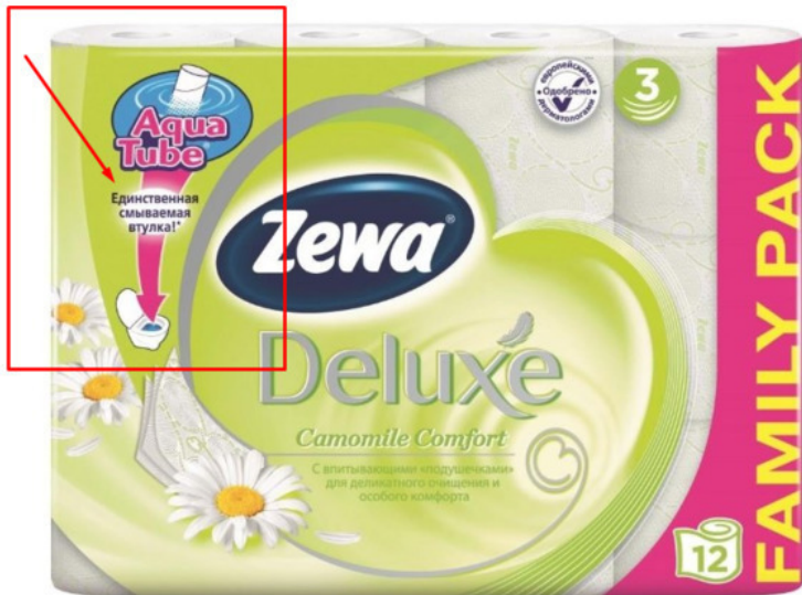
Рис.2. УТП туалетной бумаги

Если обратиться к сфере услуг, то недавно встретила такое УТП у одной из многочисленных языковых школ: