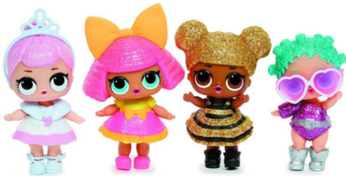
Рис.4. Оригинальные куклы LOL

Еще один хороший пример искусственного УТП – популярные сейчас «оригинальные» куклы LOL. Стоимость такой куколки начинается от 1800 руб. Идентичная «подделка» стоит от 300 руб. Но все девочки хотят именно «оригинальную». Ютуб завален роликами, где сравнивают оригинал и подделку, девочки измеряют свою крутость по числу оригинальных LOL в их коллекциях. Да что говорить, моя 6-летняя дочь со всей серьезностью рассказывала мне по пунктам, чем оригинал отличается от подделки. При том, что у не было ни того, ни другого.