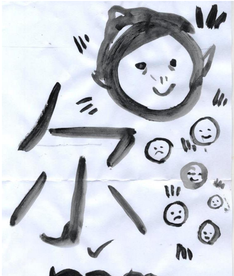
Рисунок Риты Гарнык