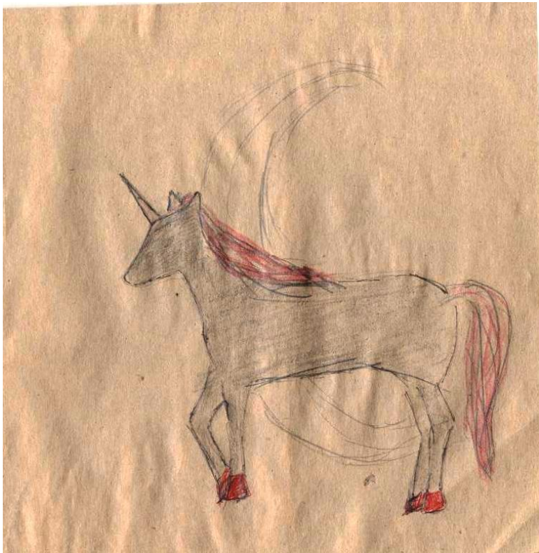
Рисунок Риты Гарнык