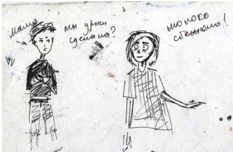
Рисунок Риты Гарнык