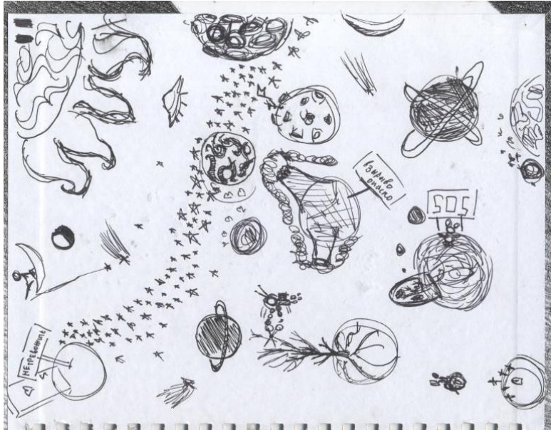
Рисунок Риты Гарнык