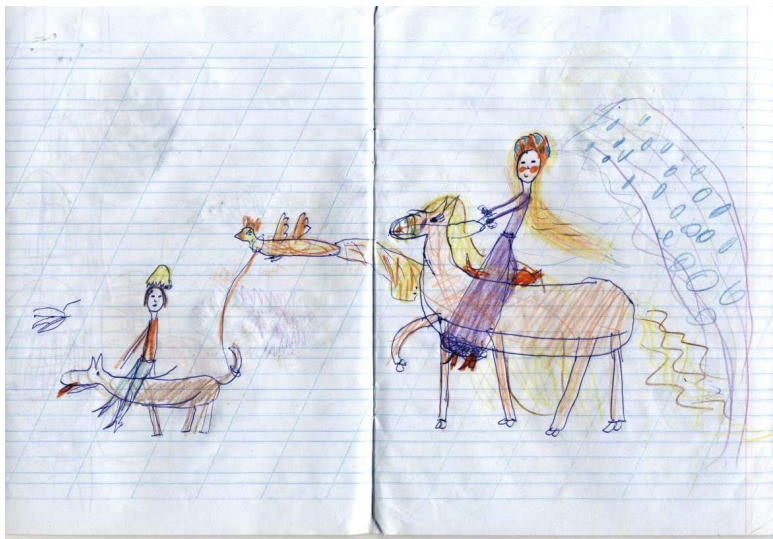
Рисунок Риты Гарнык