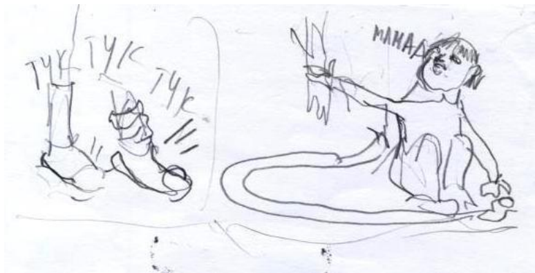
Рисунок Риты Гарнык

Диана после этого родители записали в секцию гимнастики. И она стала смелая и решительная. На занятиях тренер Диану на сложные упражнения всегда первой ставил. Если Диана сделает опорный прыжок или сальто, то и другие делают, не испугаются.