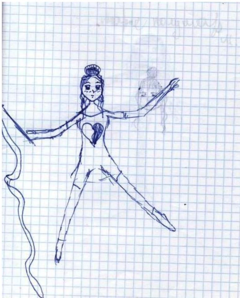
Рисунок Риты Гарнык