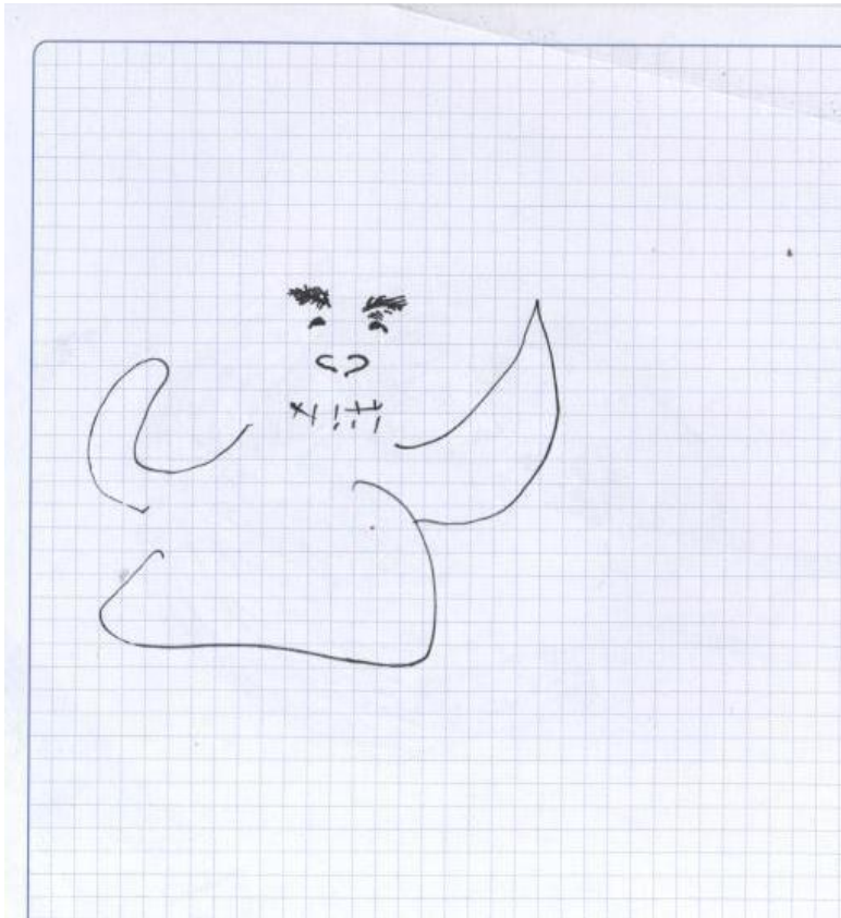
Рисунок Риты Гарнык