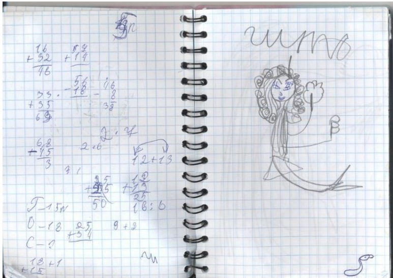
Рисунок Риты Гарнык