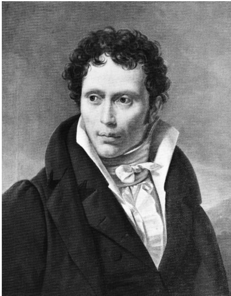
Портрет Шопенгауэра кисти Л. Руля, 1815 год.