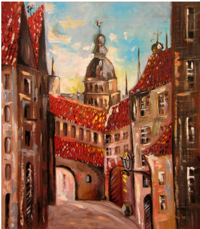
Солнце в Старой Риге (масло, холст, 60х66, 2013)