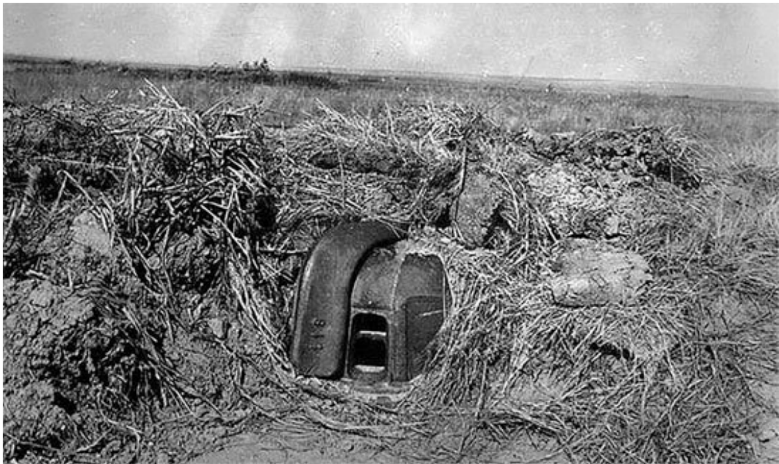
Огневая точка MG-Panzer nest, он же немецкий бронекотлак «Краб»