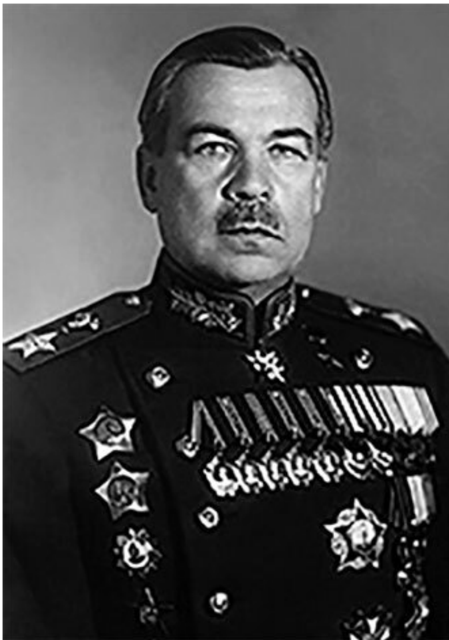
Командующий Ленинградским фронтом маршал Леонид Александрович Говоров

Сеть шоссейных, и особенно, грунтовых улучшенных дорог была развита относительно хорошо. Главным недостатком грунтовых дорог являлась узкая проезжая часть, на ряде участков затруднявшая двустороннее движение автотранспорта.