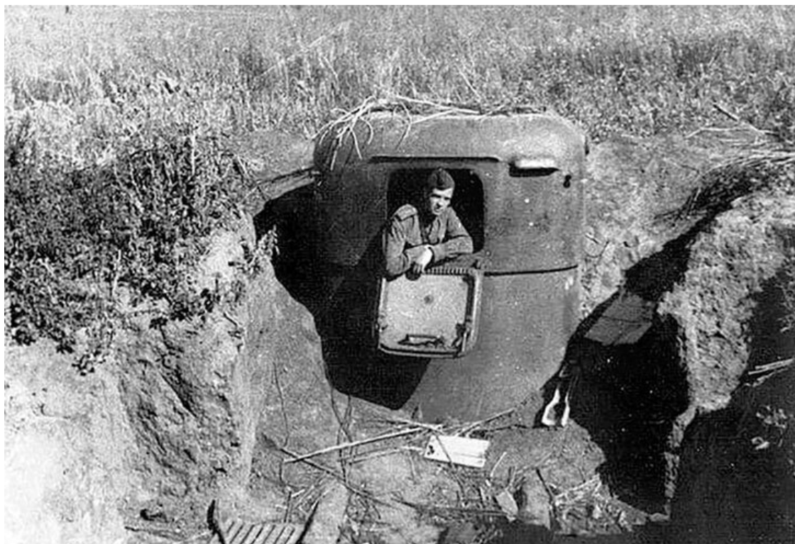
Огневая точка MG-Panzer nest, он же немецкий бронекотак «Краб».

На участке опытная станция «Стремутка» – Подсосенье оборонительный рубеж состоял из сплошных траншей в 1–4 линии. Для пулеметов были устроены открытые площадки, на важнейших направлениях установлены бронекотки. Между первой и второй траншеями были расположены металлические, железобетонные и деревянные убежища. Они были устроены заподлицо с поверхностью земли. Болотистые участки прикрыты полосой препятствий и одной траншеей. Лесные участки также прикрыты различными заграждениями и дерево-земляным забором. Участок имел ряд опорных пунктов.