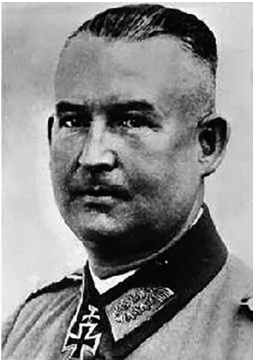
Командир XXXVIII ак генерал Курт Герцог

В вермахте существовало несколько подходов к учету численности войск. Так, в списочном составе соединений (Iststärke), кроме военнослужащих, находящихся в строю, учитывались также раненые и больные, отпускники и командированные, которые могли вернуться в части в течение 8 недель (в зависимости от обстановки на фронте этот срок мог меняться). Также учет личного состава велся по количеству «едоков», т. е. согласно продовольственным rationам выделенным соединениям (Verpflegungstärke). На довольствии в соединении находились, кроме военнослужащих, также «хиви» (хильфсвиллиге – добровольные помощники), лица, находящиеся под арестом, и кроме того гражданские лица (вольнонаемные), обслуживавшие воинские части.