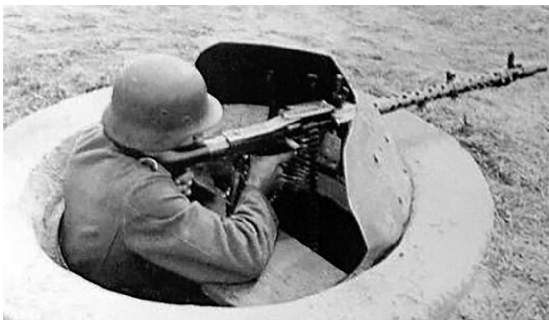
Огневая точка Тобрук с бронещитком.

3) Островский участок имел протяженность 40 км, из них 25 км в полосе 54-й армии. Передний край проходит по линии Гусаково – Тараканово – Немоево – Улазово – Красная Горка – Подъяблонка – Юшково – Жавороново и далее до Пехово. По переднему краю проходила сплошная траншея с пулеметными гнездами и ДЗОТами. У шоссе южнее Тараканово выявлены сооружения, которые не разрушаются прямыми попаданиями 122-мм снарядов. Передний край прикрыт проволочными заграждениями в 2–3 кола. На участке Подъяблонка – Заболотье был отрыт противотанковый ров. (1, л. 90–91)