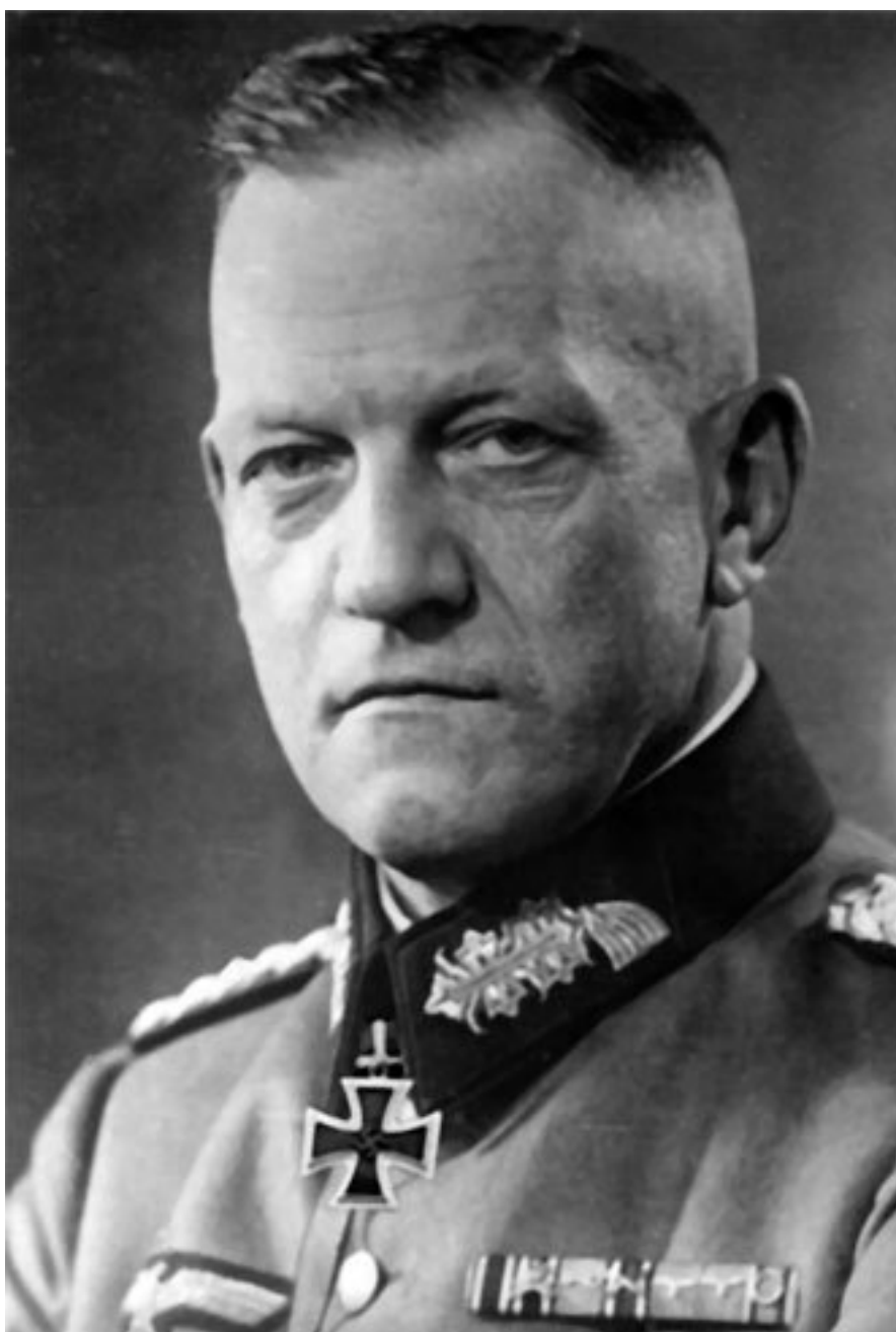
Командующий 18 А генерал Георг Линдеманн

Командующий 18-й армией генерал-лейтенант Линдеманн 1 марта отдал приказ, в котором были следующие слова: «Итак, мы достигли рубежа «Пантера», на котором мы на подготовленных позициях дадим решительный отпор. «Ни шагу назад» – вот отныне наше девиз! Враг будет пытаться прорвать наши позиции в первой же атаке. Я требую от вас бежей нашей родины. Любой шаг назад перенесет войну в воздухе и на море на территорию Германии!» (3, с. 218–219)