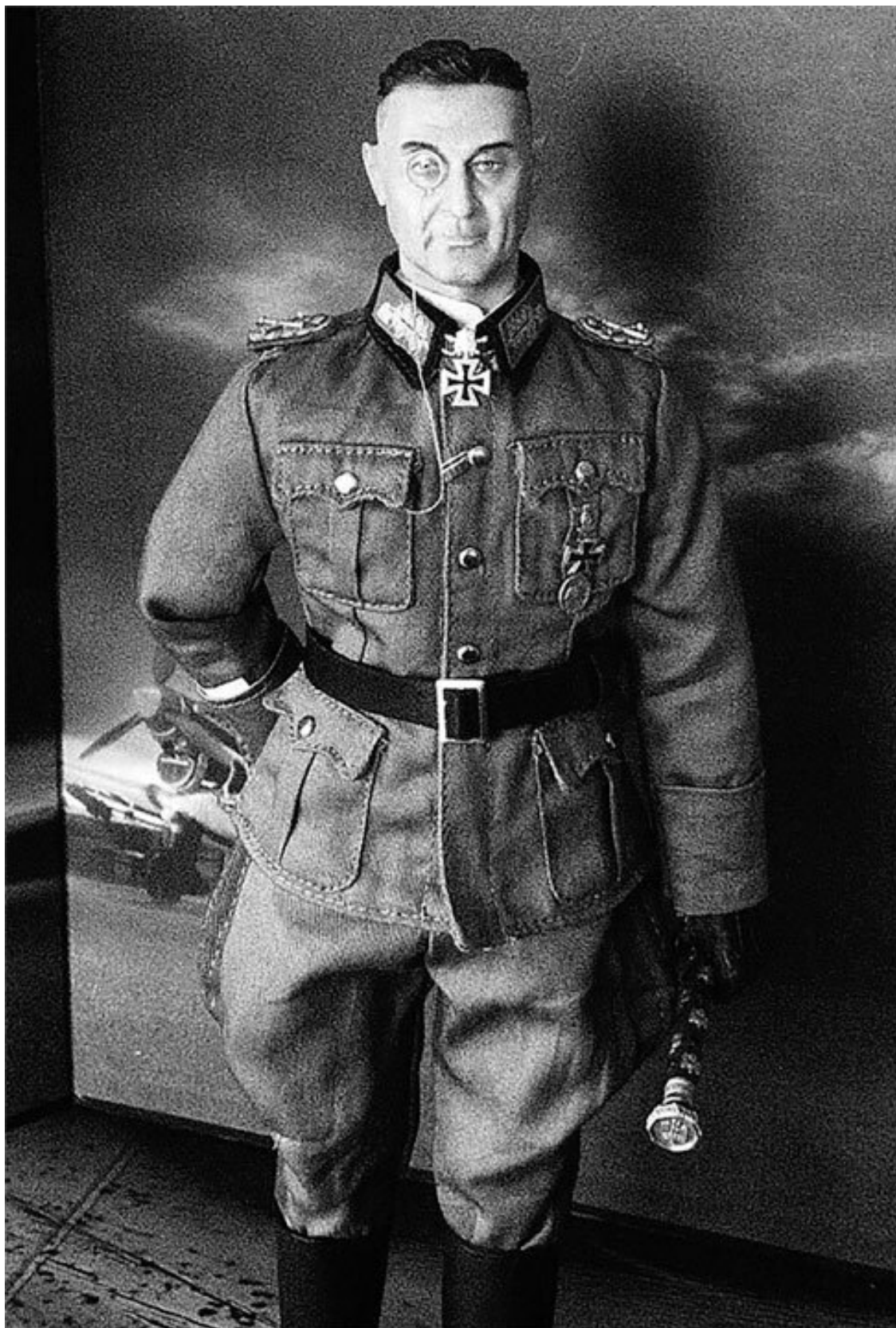
Командующий ГА Север фельдмаршал Вальтер Модель

Данными советской разведки была установлена оборонительная позиция противника на Псковско-Островском направлении. Советское командование по характеру местности и сте-