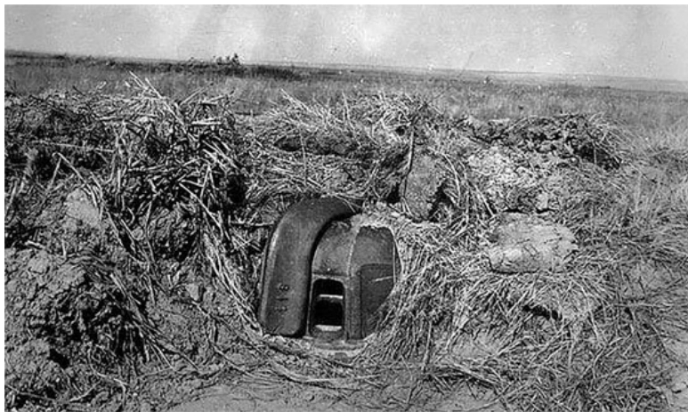
Огневая точка MG-Panzer nest, он же немецкий бронеколпак «Краб»

ки нашей пехоты. Во время артподготовки остаются на своих местах, на переднем крае, только наблюдатели. С переносом артогня в глубину, пехота быстро выбегает из укрытий и распространяется по ходам сообщения, – по траншеям, занимает свои места у открытых площадок и ведет огонь по атакующей нашей пехоте». (2, л. 1-2)