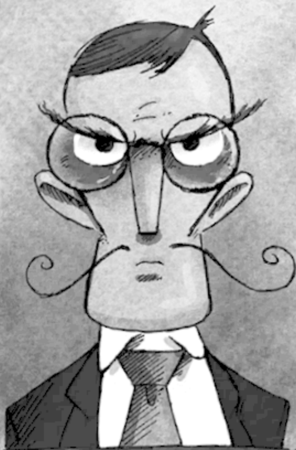
ОРСОН ЖУТКИНС 1971-?