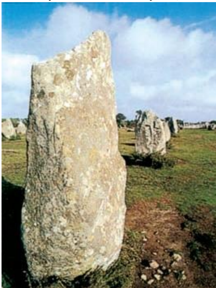
Камень в Бретани (III тысячелетие до н. э.)

Наконец, третьим регионом обитания доисторических людей стали прибрежные территории Атлантики, где сохранились до наших дней дольмены, сооруженные из огромных каменных глыб (мегалитов) и датируемые III или IV тысячелетием до н. э. Несколько позднее в разных местах Франции появились менгиры – врытые в землю продолговатые каменные глыбы высотой от 1 до 23 метров и весом до 350 тонн. Возле городка Карнак (Бретань), который называют «столицей мегалитов», можно увидеть 2935 менгиров, установленных вертикально в три ряда общей длиной 4 км. Назначение этих каменных аллей не менее таинственно, чем происхождение знаменитых идолов на полинезийском острове Пасхи (более подробно о дольменах и менгирах читайте на страницах, посвященных Бретани).