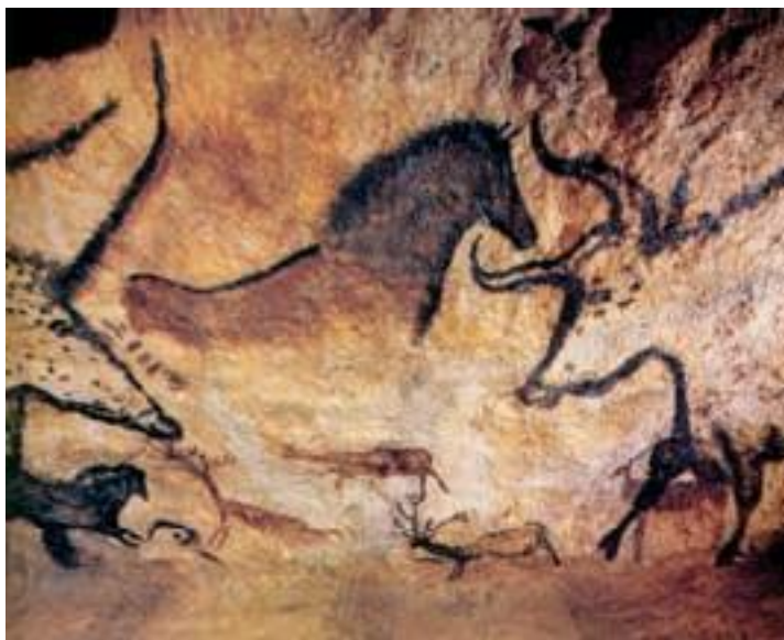
Наскальные изображения в гроте Ласко

Все вышеперечисленные гроты были обнаружены в XX веке. Эти открытия можно считать в большей или меньшей степени плодами современной археологии. Но раскопки на территории Франции велись и ранее. Так, в 1838 году археолог Жак Буше де Перт обнаружил в Пикардии, на территории французского департамента Сомм (Somme), древнейшие каменные орудия, доказав тем самым, что люди жили здесь уже в период обитания допотопных животных. Эта находка подтверждала гипотезу о древнейшем возрасте человека, выдвинутую античными авторами.