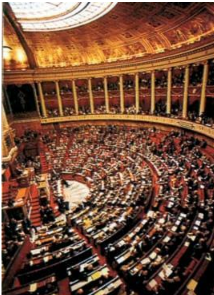
Заседание Национального собрания

Среди огромного количества названий французских провинций, департаментов, коммун и городов есть несколько названий, которые известны каждому или почти каждому в нашей стране, хотя, возможно, вы и не подозреваете, что эти слова родом из Франции.