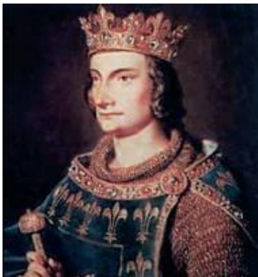
Филипп IV Красивый

В 1307 году Филипп обрушился на тамплиеров, богатый и не зависимый от короны духовно-рыцарский орден. Филиппу не давало покоя богатство тамплиеров, и под предлогом борьбы за религиозную чистоту он начал борьбу с могущественным орденом. Тамплиеры были арестованы на территории всей Франции и судимы по явно сфальсифицированным обвинениям в ереси, противоестественных пороках и союзе с мусульманами. Созванные в 1308 году Генеральные Штаты одобрили действия короля, а Папа в 1311 году под давлением Франции запретил орден, бо́льшая же часть его богатств, естественно, отошла во французскую казну. В марте 1314 года были сожжены высшие сановники ордена, в том числе Великий магистр Жак де Моле, который перед смертью проклял короля и посулил ему скорую смерть.