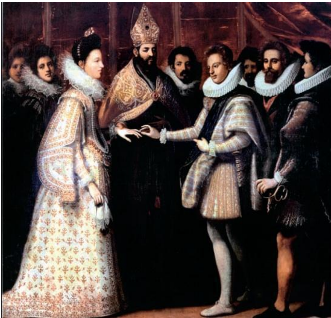
Екатерина Медичи в окружении двора

Фактически же Францией до 1570 года правила Екатерина Медичи, мать короля. На начальном этапе религиозных распрей она пыталась сохранить равновесие между Гизами и дворянской оппозицией и влиять на дела. Однако мартовские события 1562 года разрушили ее планы. 1 марта этого года Франсуа де Гиз расправился в местечке Вассы с толпой гугенотов в то время, как они мирно отправляли богослужение. Было убито 23 человека и еще почти 200 ранено. Эта кровавая расправа послужила поводом для начала религиозных войн между католиками и протестантами, продолжавшихся до 1598 года.