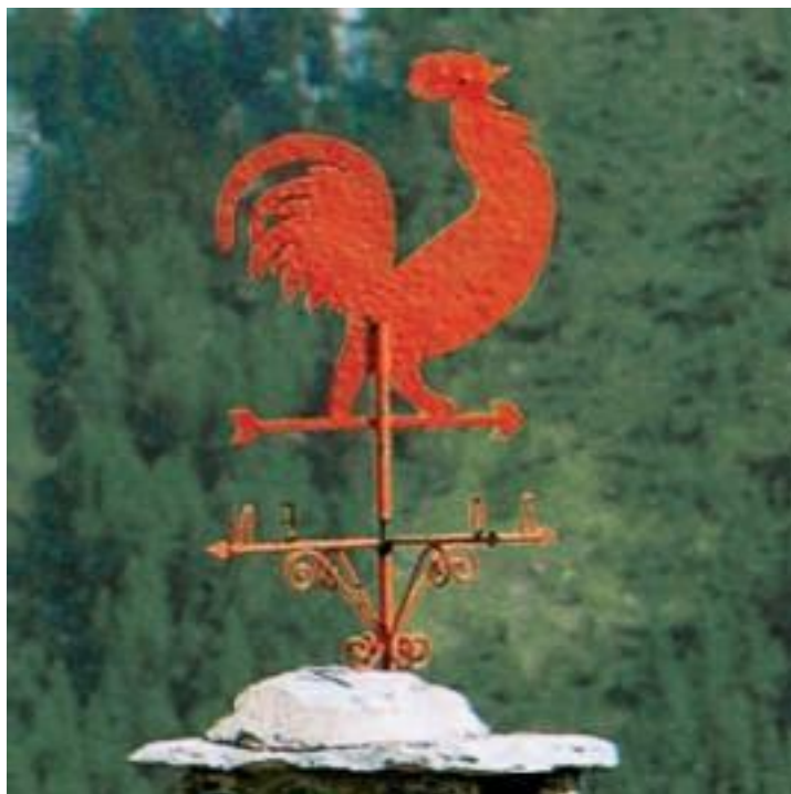
Галльский петух – символ Франции