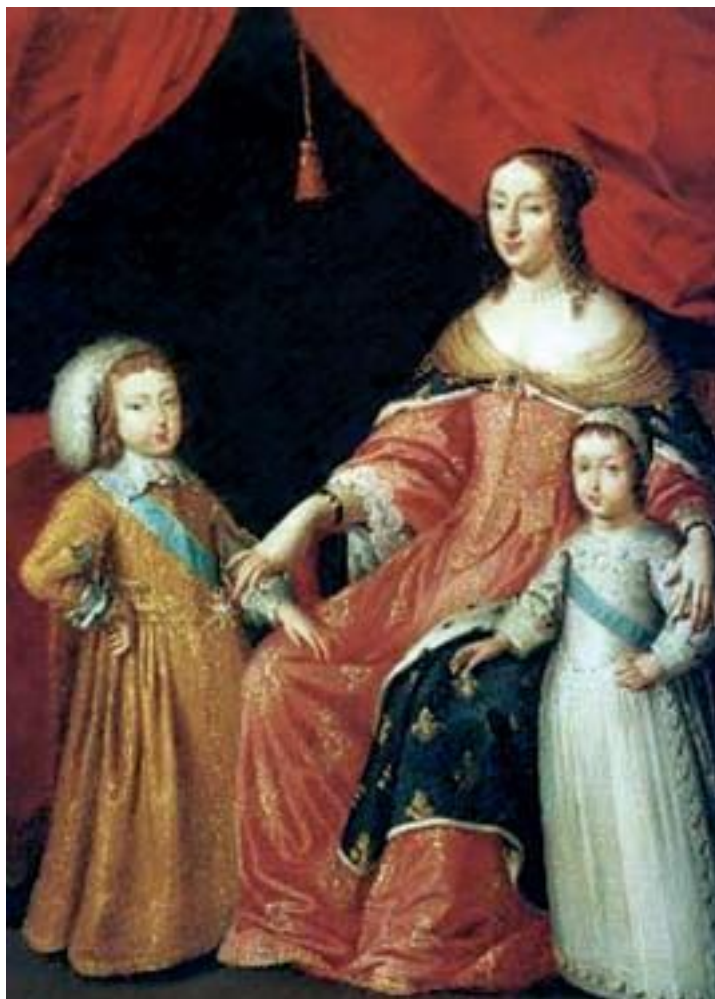
Анна Австрийская с детьми

Однако этот коварный кардинал сыграл чрезвычайно важную роль в истории Франции, поэтому заслужил несколько строк в этой книге.