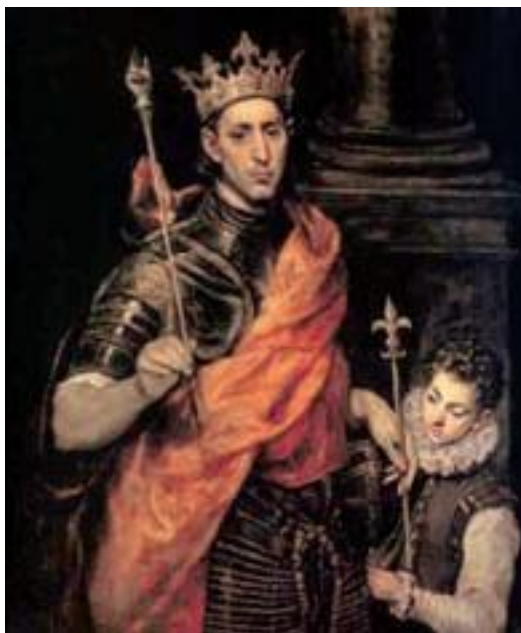
Людовик IX Святой

8 ноября 1226 года французский трон занял старший сын Людовика VIII и Бланки Кастильской Людовик IX Святой (Louis IX le Saint). Людовик родился 25 апреля 1214 года. Несложно подсчитать, что на момент коронации юному королю было всего 12 лет. Вместе со своим дедом, Филиппом II Августом, и внуком, Филиппом IV Красивым, Людовика называют одним из «трех великих Капетингов». Помимо своей славы Святого короля-крестоносца, образцового христианского рыцаря, Людовик IX вошел в историю как правитель, который поднимал престиж королевской власти, развил и преобразовал административную структуру государства.