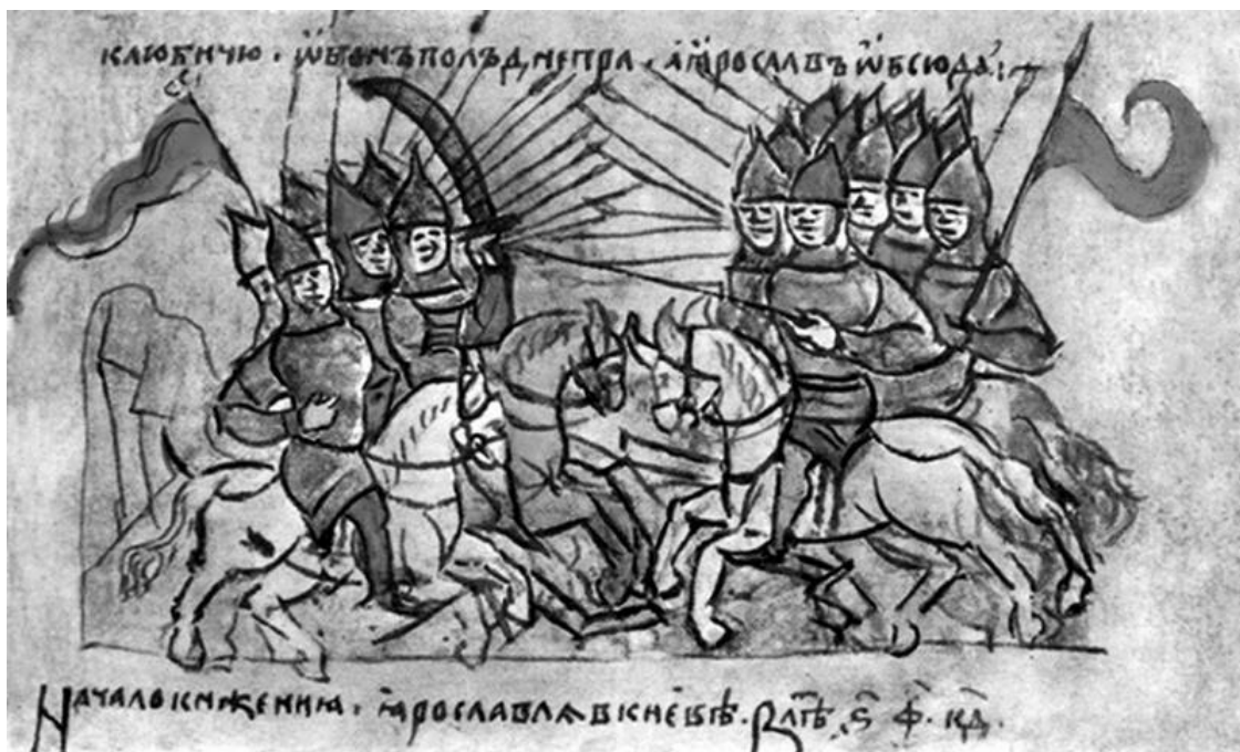
Миниатюра «Битва Ярослава со Святополком» из Радзивилловской летописи. XV век

В это время Ярослав не имел достаточно сил, чтобы одержать победу над высокоодаренным полководцем Мстиславом (о чем свидетельствовало сокрушительное поражение великого князя Киевского в 1024 г. в сражении у Листвена, о которой более подробно мы скажем далее в очерке, посвященном военной деятельности тмутараканского князя), который недаром получил прозвище Удалой. В лучшем случае, его ожидала бы дальнейшая затяжная война без малейших гарантий победы, чем, несомненно, воспользовались бы как многочисленные русские князья, недовольные жесткой централизаторской политикой Ярослава, так и внешние силы, не оставившие надежд на захват территорий Киевской Руси. Показательно, что Мстислав Удалой, подобно Святополку Окаянному, в борьбе против Ярослава опирался на серьезную внешнюю поддержку давних неприятелей Киевской Руси – хазар и черкесов (черкасов).