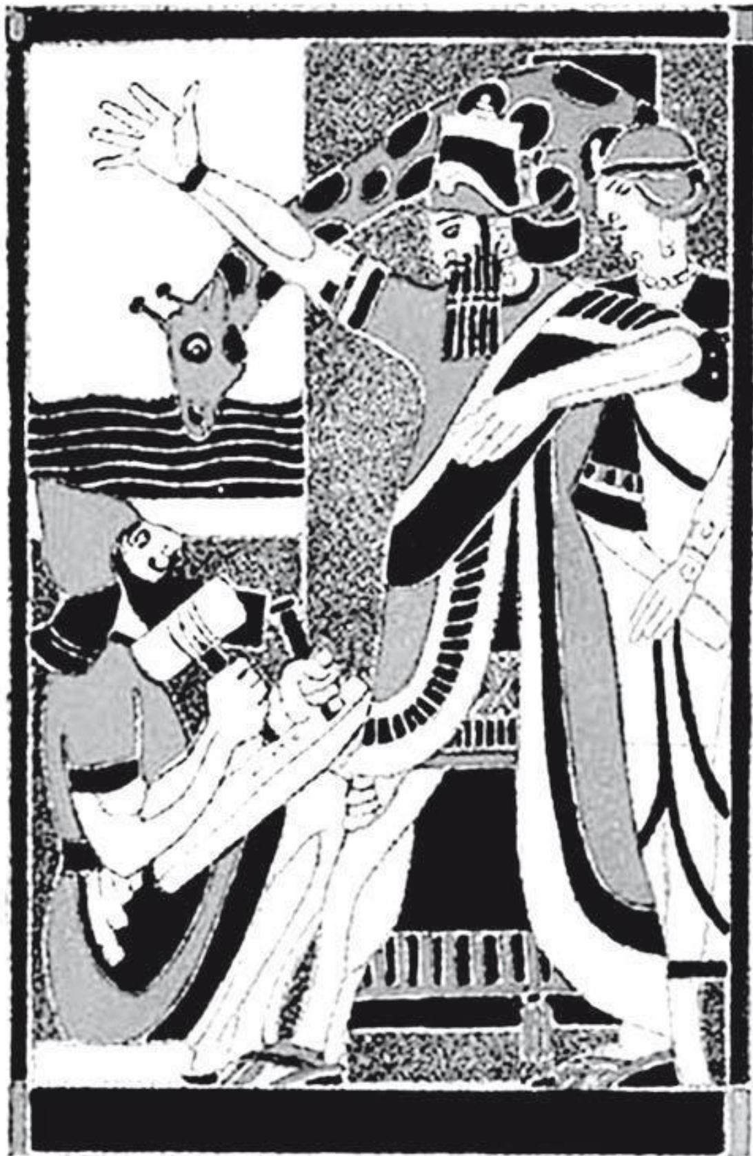
Ной. Неизвестный художник

Археологам суждено было извлечь из давно утерянных архивов Ассирии подлинную вавилонскую версию легенды. При раскопках Ниневии, составляющих славу и гордость XIX