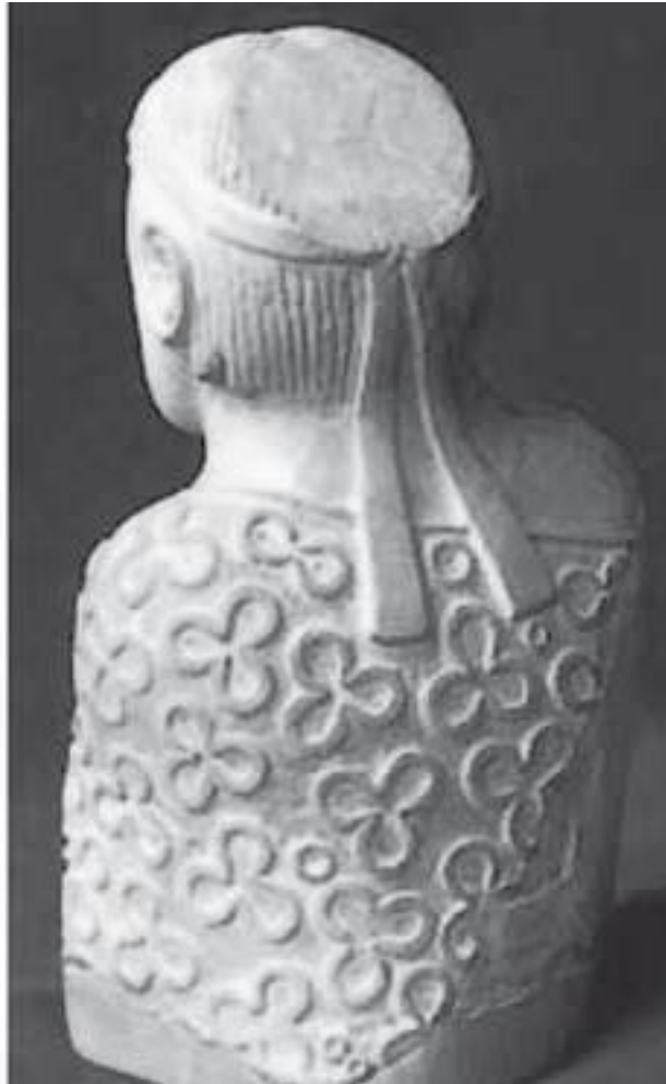
Посуда и статуэтка царя, найденные на территории Мохенджо-Даро

Получившиеся заготовки долго и тщательно полировали все более тонкими абразивами. А когда керамика получила широкое распространение и достигла высокого качества, гончары стали полировать (лощить) свои изделия, подражая сосудам из полированного камня.