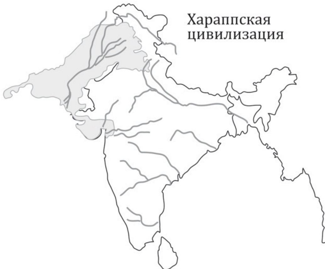
Карта Индии с обозначением границ хараппской цивилизации

Но, несмотря на множество доказательств дравидского происхождения хараппской цивилизации, эта гипотеза и сейчас вызывает много возражений. И прежде всего у самих индийских историков, которые склонны преуменьшать достижения Хараппы – ведь сейчас дравиды относятся к самым отсталым народностям Индии 3 .