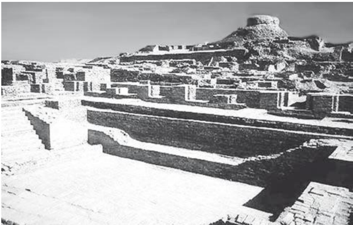
Раскопки в Мохенджо-Даро

Культовые сооружения в хараппских городах были не только в цитадели, но и в нижнем городе. Одно из таких зданий с остатками каменной скульптуры раскопал английский археолог М. Уилер в Мохенджо-Даро. Возможно, что это был храм для людей, которые по каким-либо причинам не могли участвовать в ритуалах в цитадели. Это большое здание на массивной платформе имело несколько этажей. Верхние этажи, построенные из дерева, не сохранились, но на их существование указывает кирпичная лестница.