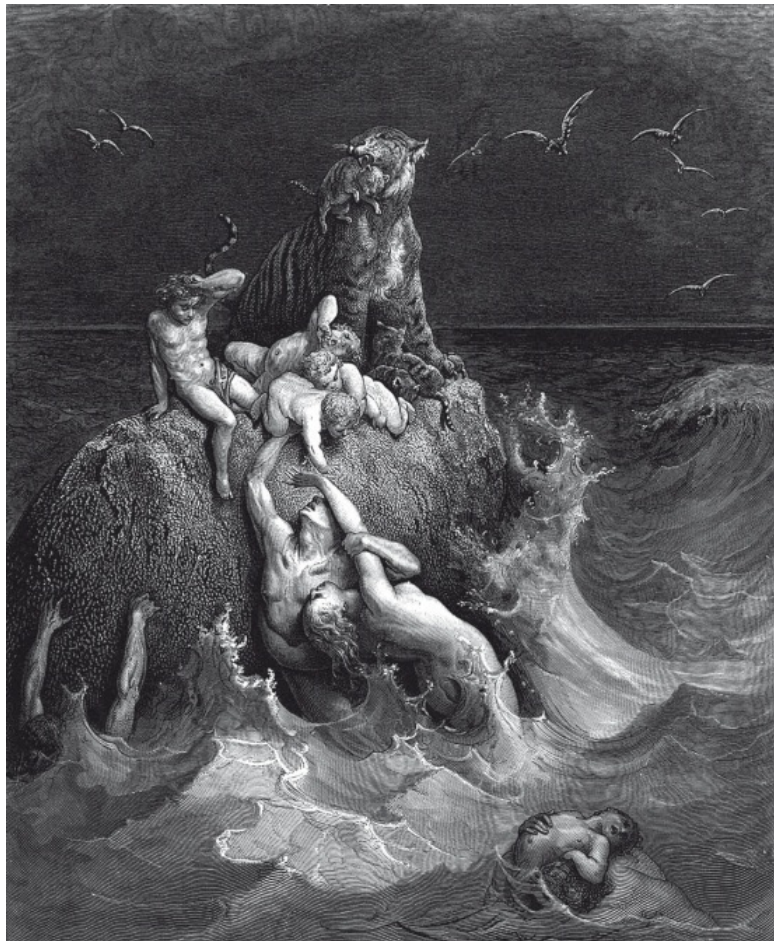
Всемирный потоп. Худ. Г. Доре

Яхвист и Элохист, образовавшие вместе рассказ о Вели-