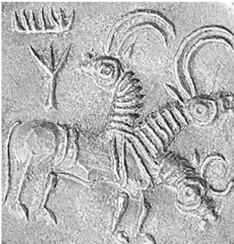
Образец печати, найденный на территории харапского

время. Найденные в Шумере прямоугольные печати были, вероятно, случайно обронены индийскими купцами, привозившими в Месопотамию слоновую кость и другие товары. Вот так утерянные вещи стали загадкой, над которой долгие годы ломали головы ученые мужи.