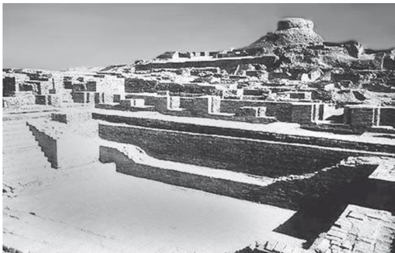
Раскопки в Моходжо-Даро

защищать не только физически, но и на магическом уровне – ведь чужеземцы-захватчики не исполняли религиозных предписаний, а значит, были культово нечистыми. Чистый материал должен был отвергнуть нечистых... Может быть, такой взгляд на мир покажется современному человеку излишне наивным: ведь в конце концов хараппская цивилизация погибла. Но не будем судить строго людей, населявших нашу планету в древности. Они создавали свой мир, совершенно не заботясь о том, как они будут выглядеть в глазах далеких потомков, и старались сделать его удобным и уютным.