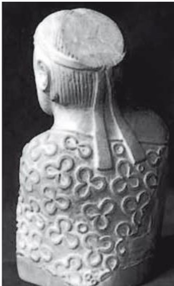
Посуда и статуэтка царя