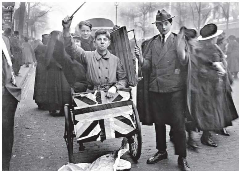
Инвалид на коляске с английским флагом. Лондон, 1919

колониальной свободы применялся к территориям, которые были «созданы британским народом или... с таким приращением британского народа, который бы позволял ввести представительские институты». 31 В эпоху колониальной экспансии расширяется территория владений вокруг военных баз и изменяются системы управления каждым типом, что и приводит к различению собственно колоний и доминионов.