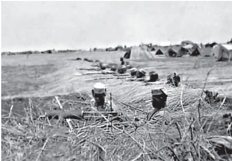
Британские стрелки в Африке