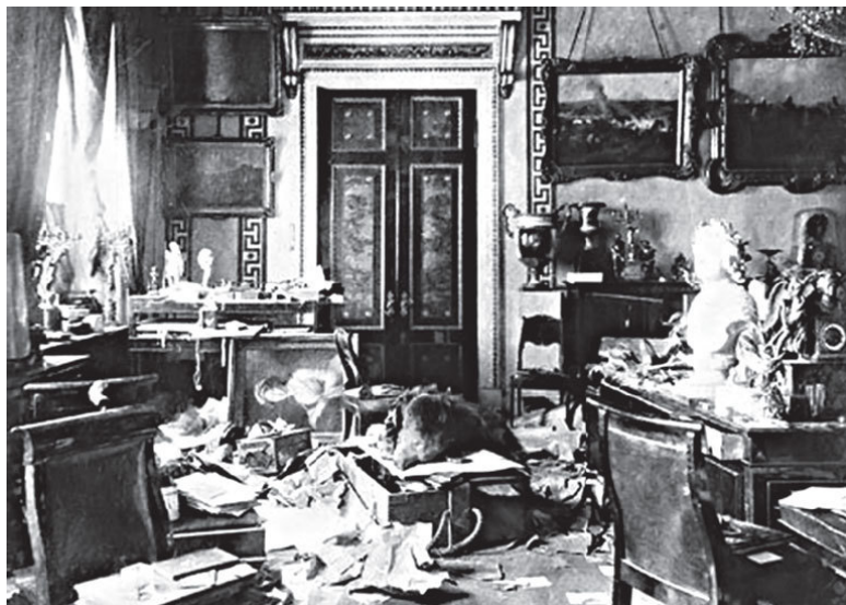
В Зимнем дворце после штурма

В Смольном открылся наконец II Всероссийский съезд Советов, который предоставил видимую легитимность большевистскому правительству.