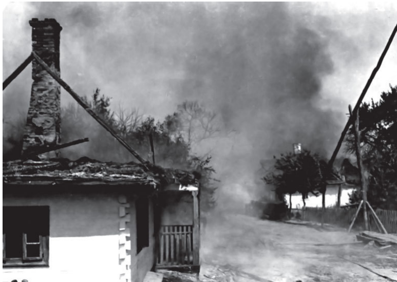
Пылающая деревня на Восточном фронте. Польша, 1915

Среди огромного количества книг и статей на темы колониальной политики и империализма, которые писались в начале XX века, выделяются многочисленные труды «еретического» английского экономиста и политического писателя левой ориентации Джона А. Гобсона. Он отправился в 1899 г. в Южную Африку, чтобы писать об англо-бурской войне, познакомился с реальностью жизни колоний, с выдающимися деятелями тогдашней колониальной политики и пришел к выводу о том, что в колониях действует «особенно