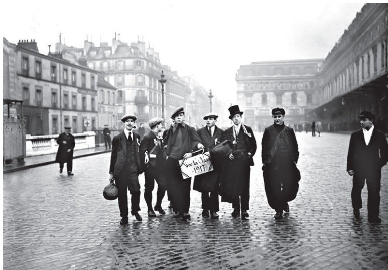
Новобранцы на Лионском вокзале. Париж, 1916

1871 г. При этом, хотя франко-прусская война была самой кровавой из всех посленаполеоновских войн XIX ст., все же погибло на ней лишь немногим больше, чем на Крымской войне: в обеих странах вместе потери достигали 57 тыс. человек убитыми. 29 Когда император Вильгельм II перед лицом поражения сказал: «Мы не хотели этой войны», – английский премьер-министр Ллойд-Джордж саркастически подтвердил: «Да, такой войны они не хотели».