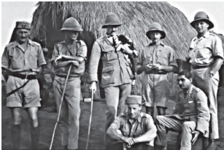
Английские офицеры с собачкой

тов стерлингов, 3,3 млрд франков, 1,8 млрд марок; на Балканах – 2,5 млрд франков и 1,7 млрд марок. Но в Америке и английских доминионах немцы имели намного больше – 7,5 млрд марок против 3,5 в Турции и на Балканах; Франция – 8 млрд франков против 5,8 в Турции и на Балканах!