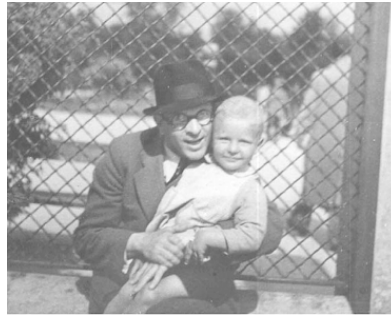
З батьком. 1941 р.

Вертаючись до тих розкошеств, у яких я зустрів пору свого раннього дитинства: у вересні Варшаву почали бомбувати, і надмірним турботам про гігієну настав кінець. Коли повиходили з ладу водогони, мама в ложечці кип'ятила над свічкою воду з калюжі – можливо, саме завдяки цьому я не виріс алергіком.