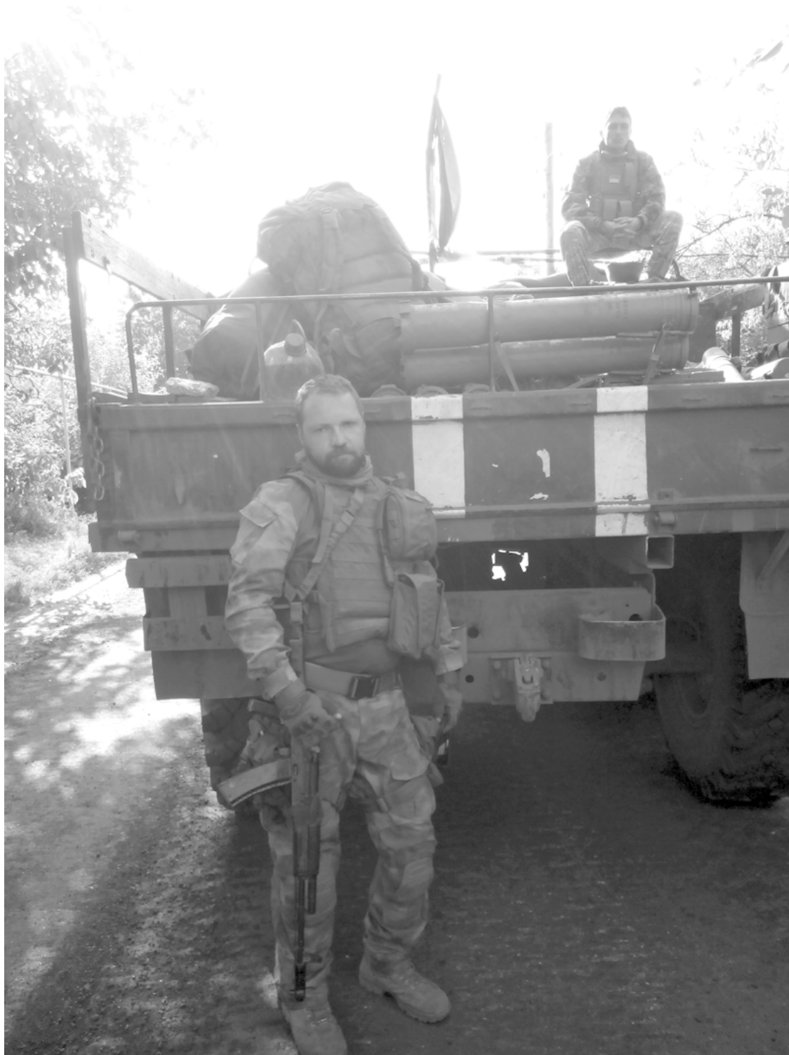
Фото по приезду в Петровское.

В кузове «урала» 72-й бригады у меня под ногами оказался кевларовый «шуберт» огромного размера: