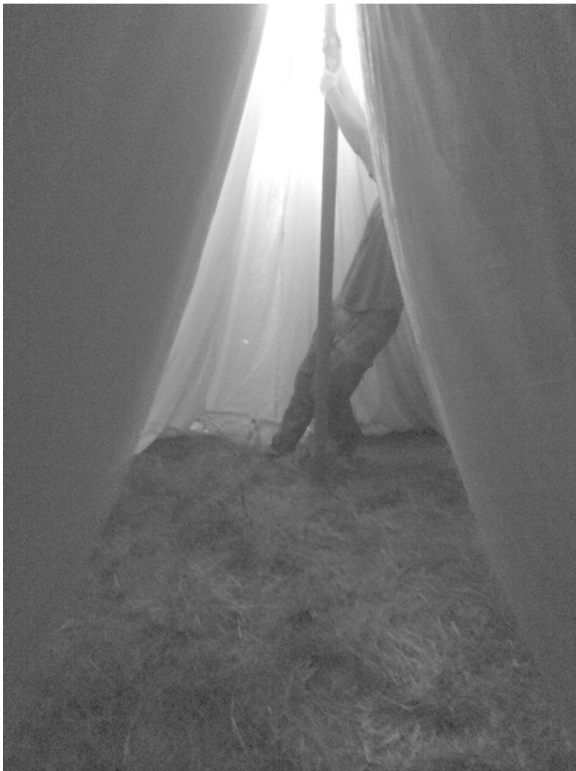
Ваня «Ганс» удерживает опорный шест палатки, пока остальные расправляют полотно и устанавливают боковые опоры.