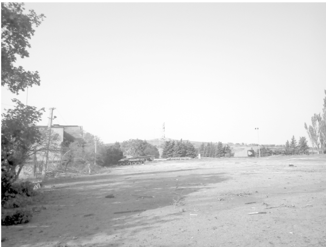
Вид на Саур-Могилу с нижней площадки

Череди лиц. Родных и малознакомых. Некоторые не вернулись с той Шайтан-Горы. Другие нашли свою смерть в иных квадратах под другими координатами. О судьбе остальных можно лишь догадываться, надеяться что всё у них сложилось хорошо. Номера поменялись, телефоны сгорели, люди канули в реку войны. Вынырнут ли они однажды из неё – никто не знает. Берегов пока не видно.