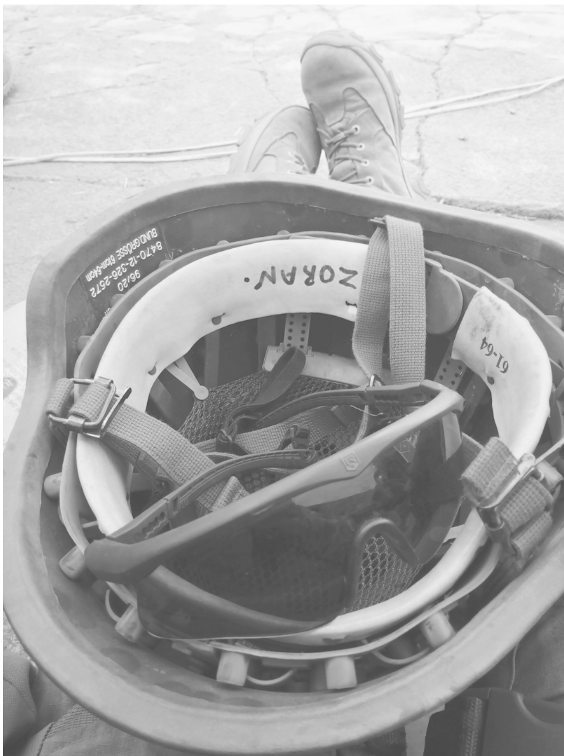
Каска-сомбреро, попавшая ко мне в результате «шутки» бойцов 72-й бригады.