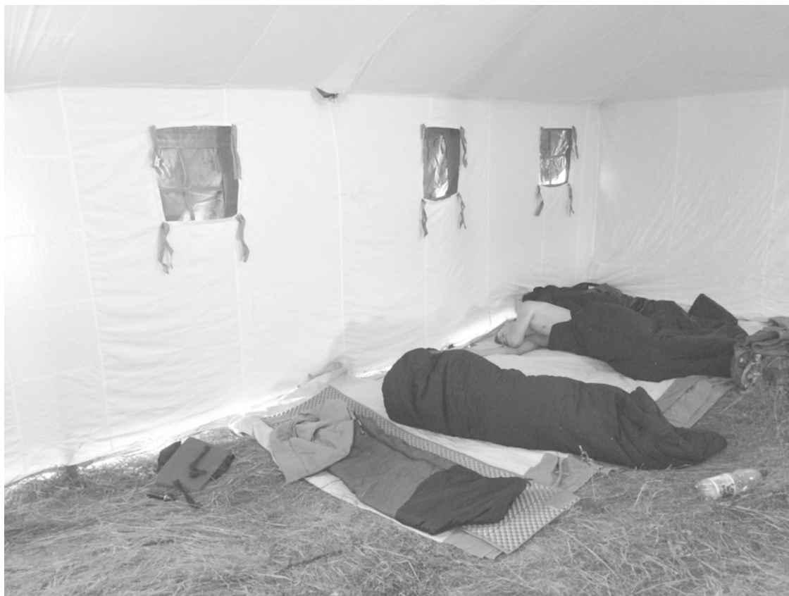
Утро после установки палатки.