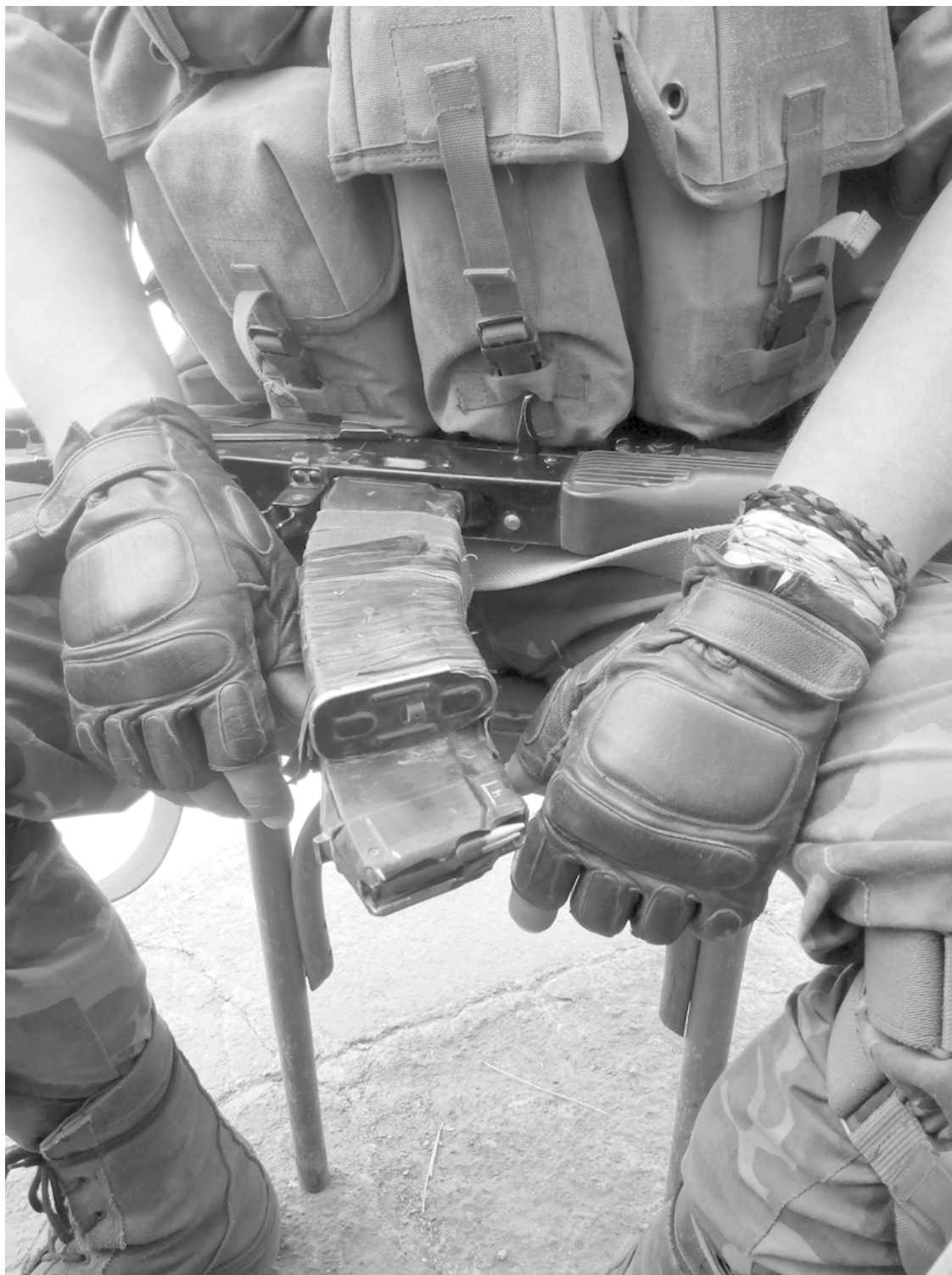
Руки бойца 51-й бригады.

Вернувшиеся со штурма курили. У некоторых дрожали руки. Бойцы 51-й вспоминали ушедшего товарища: