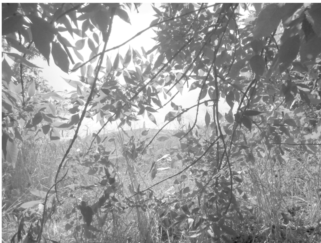
Вид на Саур-Могилу из нашего укрытия.

Из зарослей мы смотрели на высоту в единственный бинокль и мой монокуляр. Высмотрели, что искали. Мощные антенны связи, по которой, очевидно, корректировался огонь артиллерии. На следующий день эти антенны будут уничтожены нашим огнём.