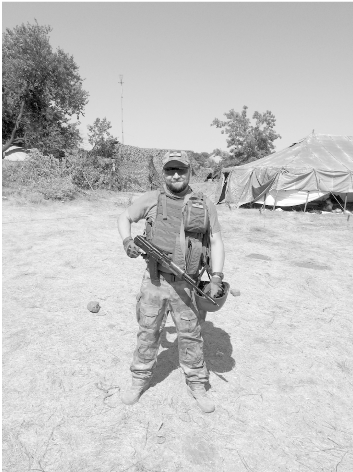
Перед выездом на встречу генерала.

Приняв душ и переодевшись, мы успели на ужин в столовую. Вечерняя прохлада немного развеяла жару, и несмотря на бессонную ночь спать не хотелось. Ночлег был организован в новой палатке. Каждый из нас четверых мог занять любое место. Поскольку кровати нам привезли без матрасов, то спали мы всё равно на карематах и в спальниках на земле.