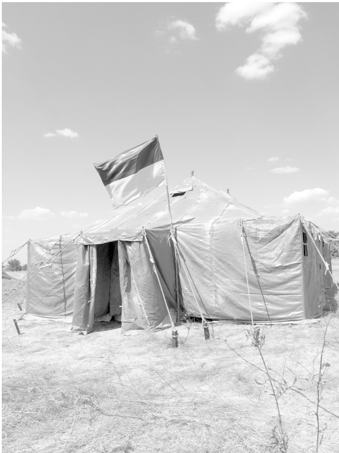
Наша палатка с флагом от полтавских друзей.