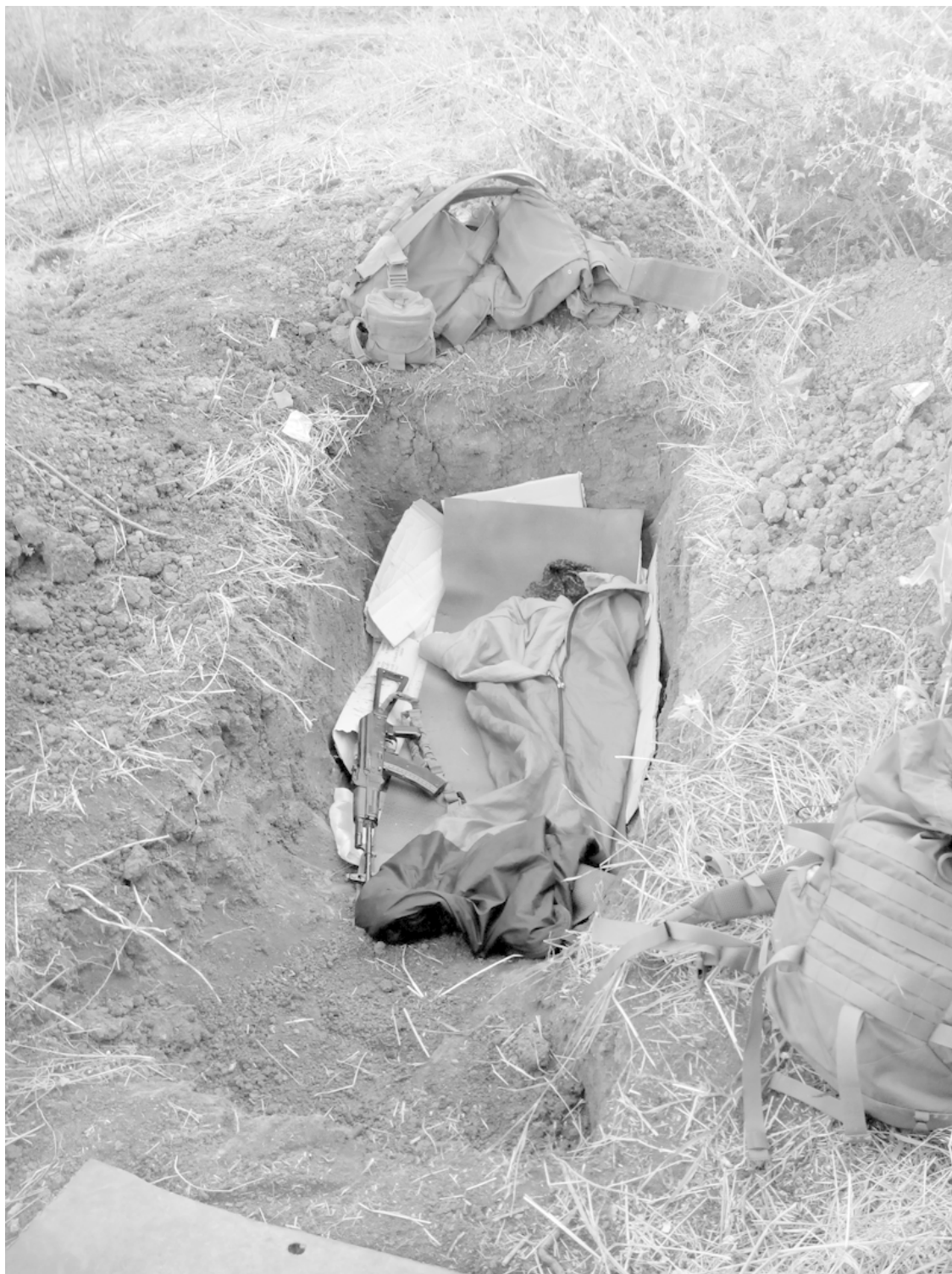
Мой спальный одиночный окоп рядом со штабом.