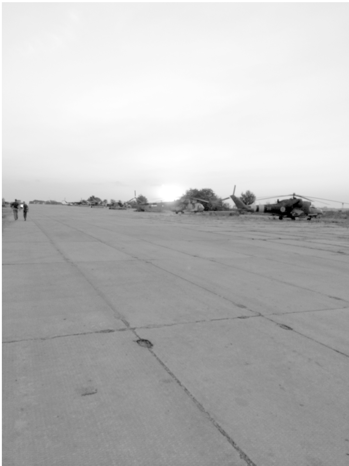
Закат на Краматорском аэродроме.