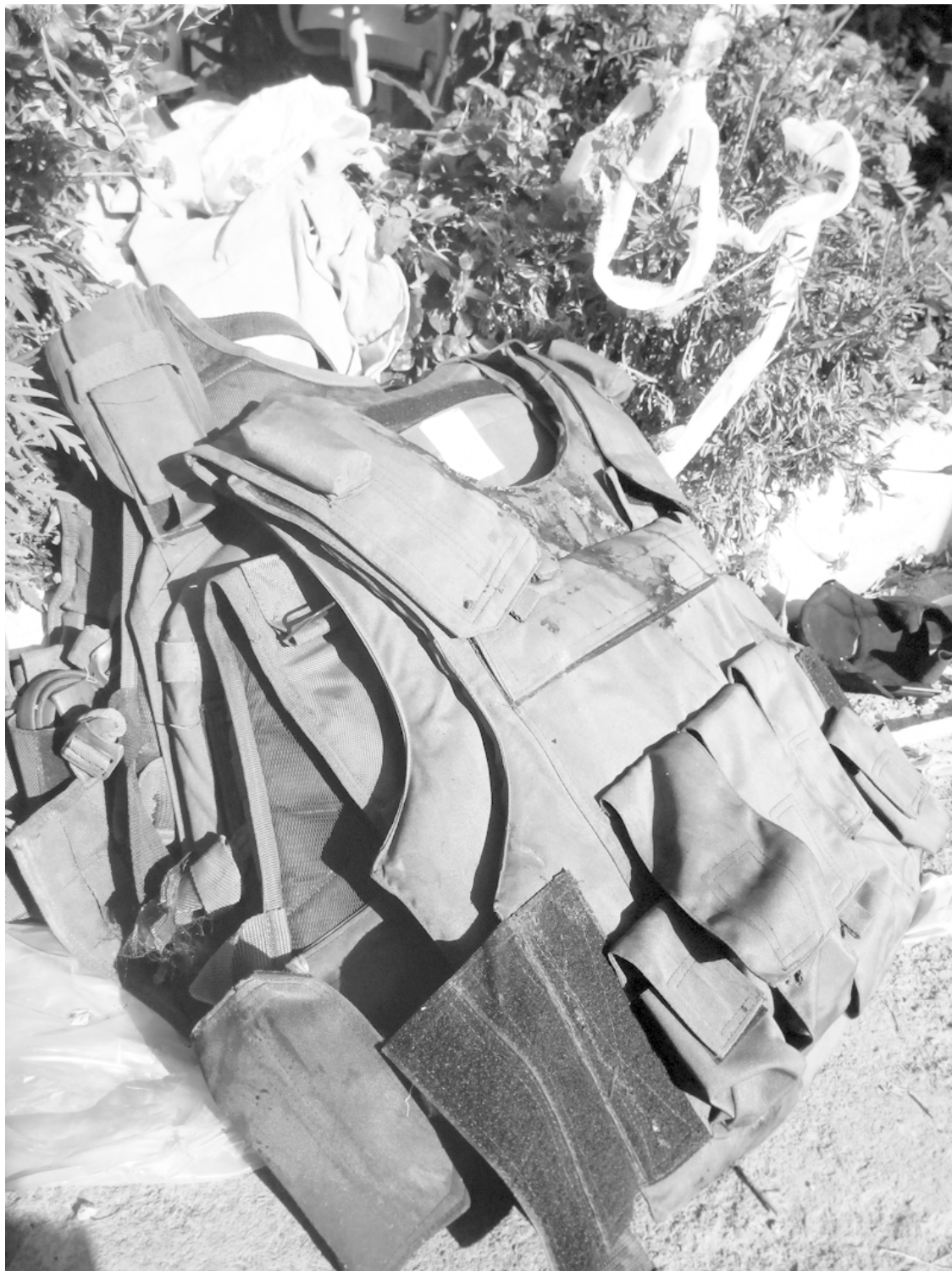
Бронежилеты снятые с раненых и убитых бойцов у медпункта.

С насюка Шайтан-Гора не далась. Но завтра будет новый штурм, в этом никто не сомневался.