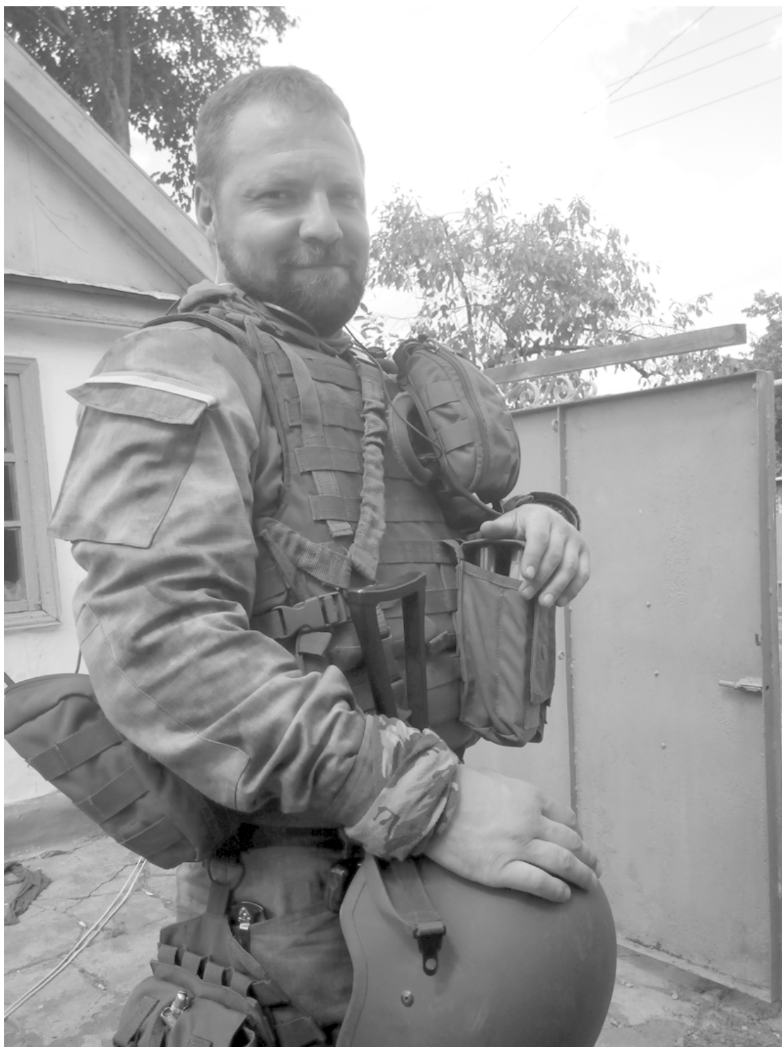
Во дворе у штаба.