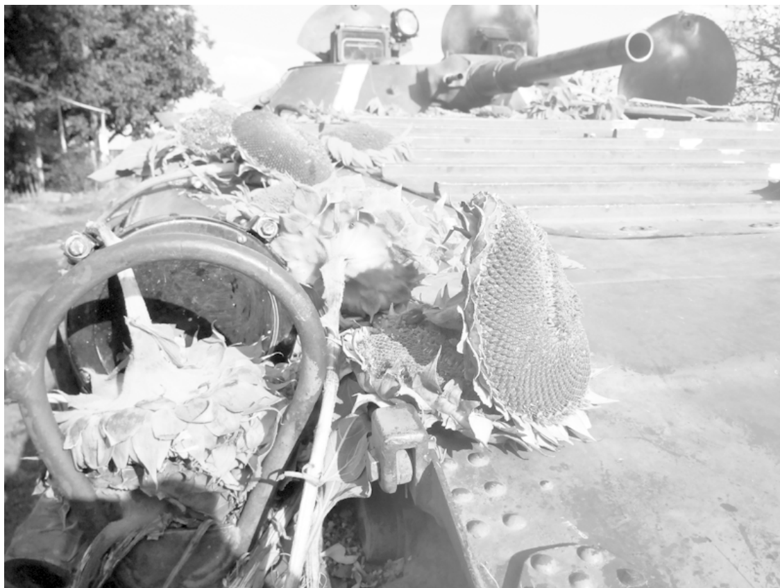
После возвращения с разведки.