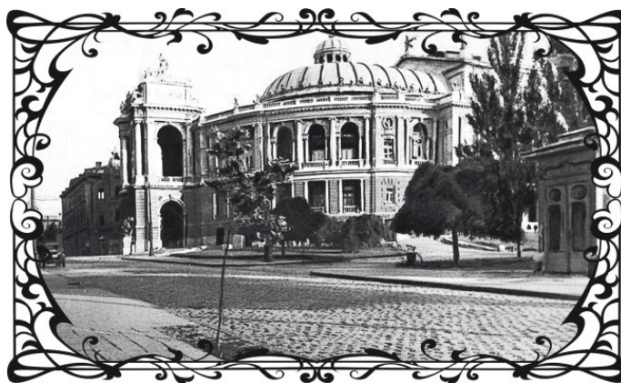
Одесса, 1918 год

Гул голосов отражался от потолка, тонул под крышей и разносился по всему верхнему этажу – там, где находились раздевалки и гримерки статисток. Роскошное снаружи, внутри здание Оперного театра было многоярусным. И самый низший театральный персонал (статисты театра, создающие в любой массовой сцене фон) занимал верхний этаж, где разделенные комнаты служили одновременно и раздевалками, и гримерками, и местом для репетиций.