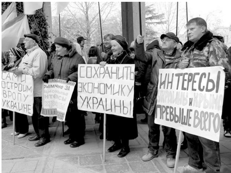
27 ноября 2013 г., Симферополь. Митинг против вступления в ЕС