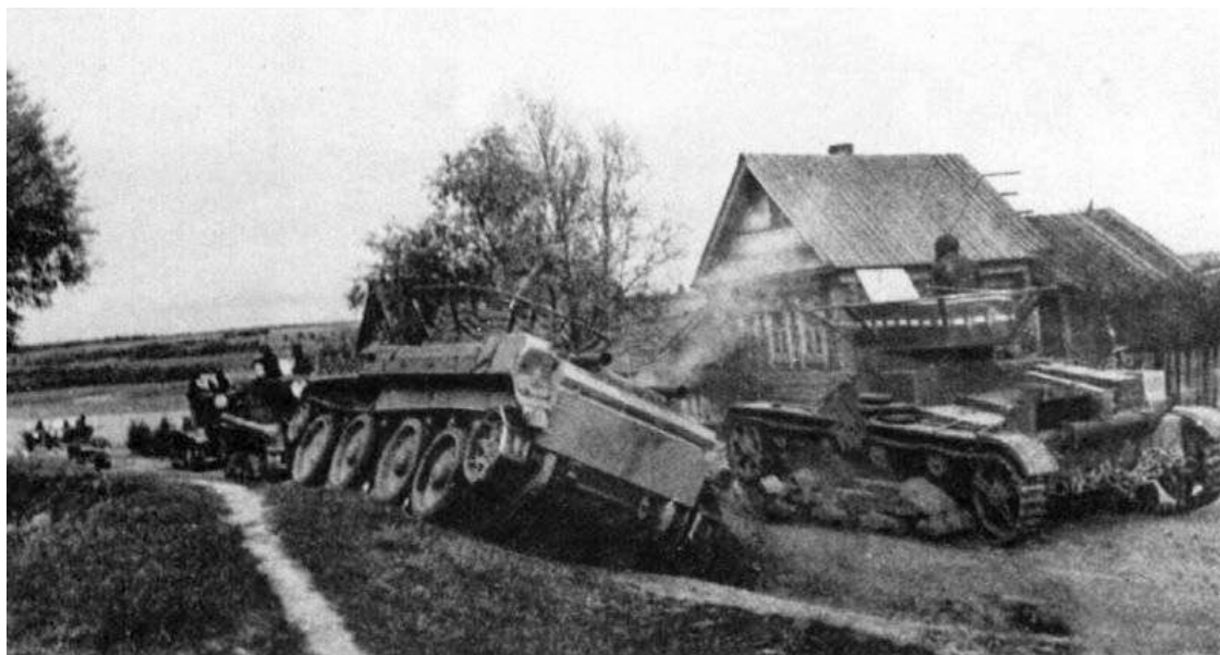
БТ-7 и Т-26 на окраине села во время предвоенных учений