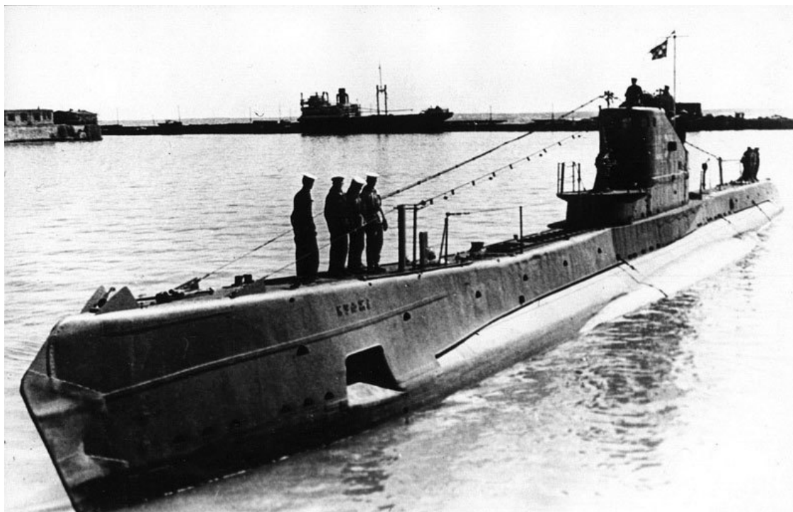
Советская подводная лодка Щ-311 «Кумжа» (тип «Щука», серия V-бис-2) в гавани Кронштадта. 1940 год