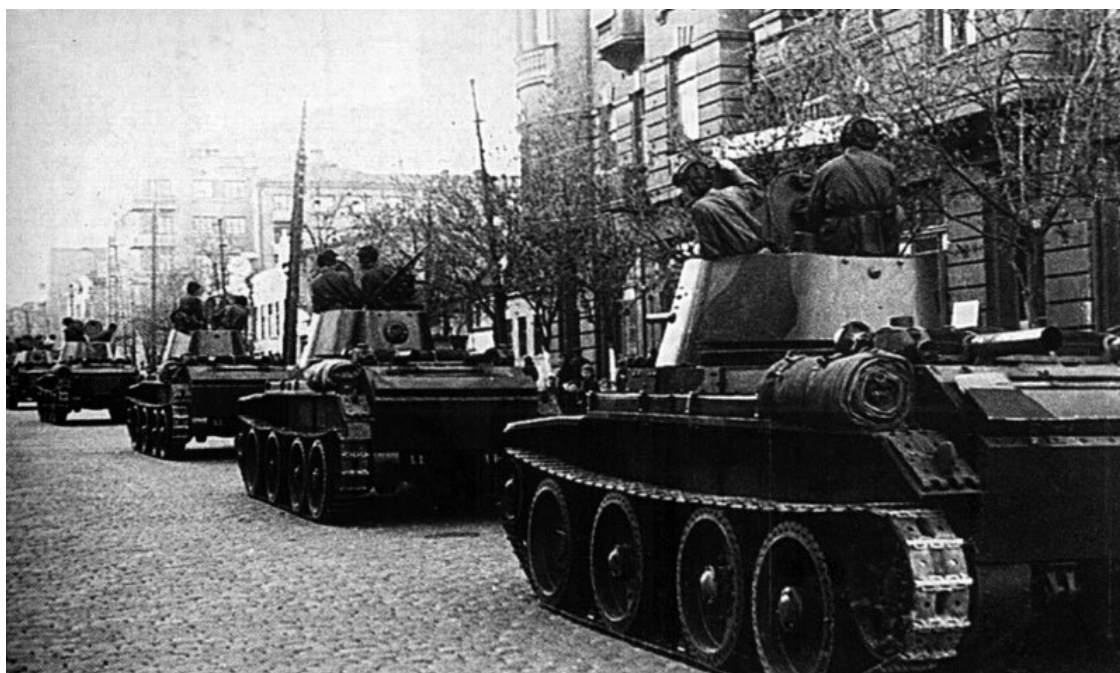
Танки БТ-7 советской 24-й легкотанковой бригады входят в город Львов. 19.09.1939