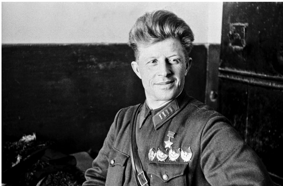
Герой-Советского Союза полковник А. И. Родимцев