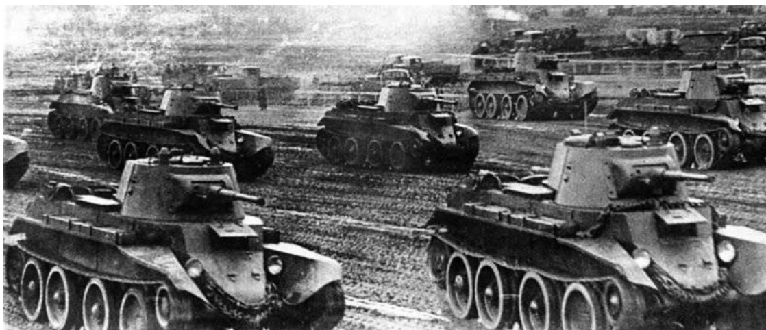
БТ-7 образца 1937 г. 7-го МВО на учениях в октябре 1940 г.