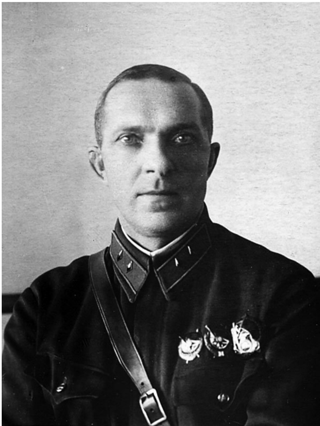
М. Ф. Лукин перед Великой Отечественной войной

Сразу подскажу читателю, каким образом командарм Лукин оказался на Киевском вокзале 13 июня 1941 года: его 16-я армия, совсем недавно находившаяся в Забайкалье – для защиты Монголии от Японии – начиная с 26 мая спешно перебрасывалась в Украину (там