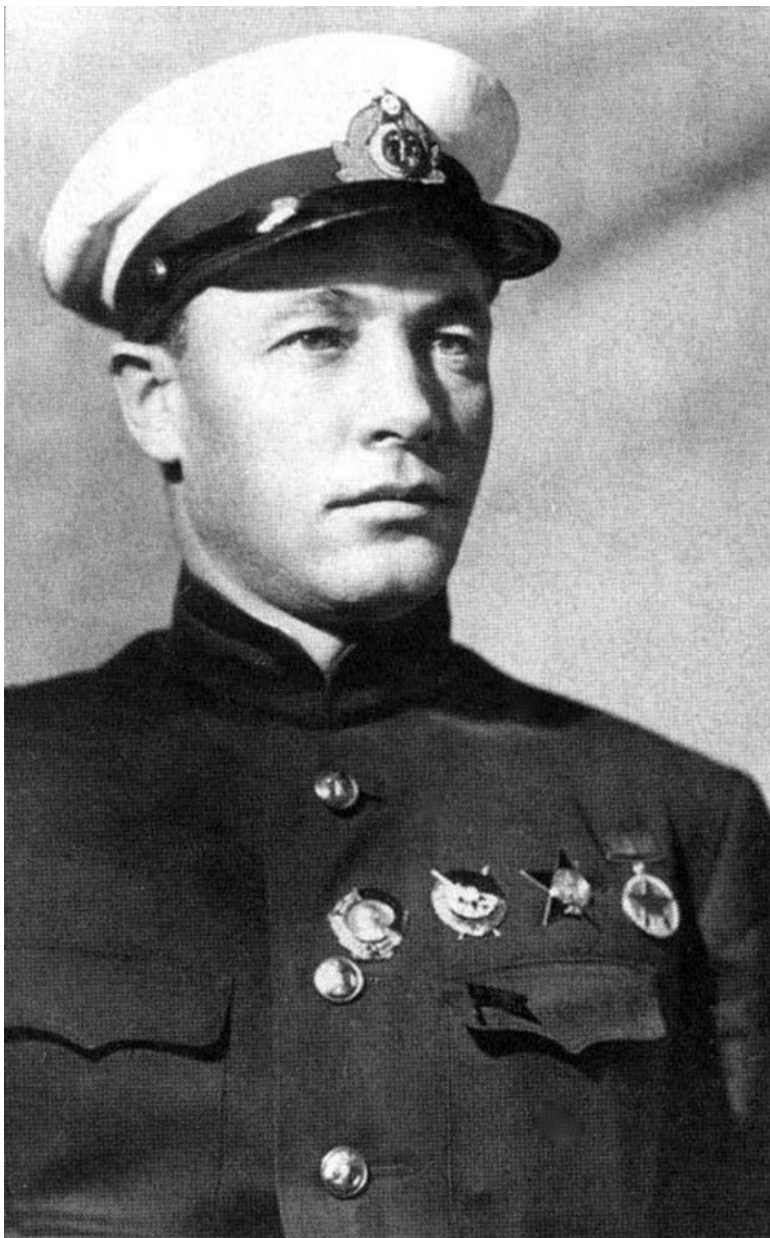
Командующий Тихоокеанским флотом флагман 2-го ранга Н. Г. Кузнецов в 1938 году