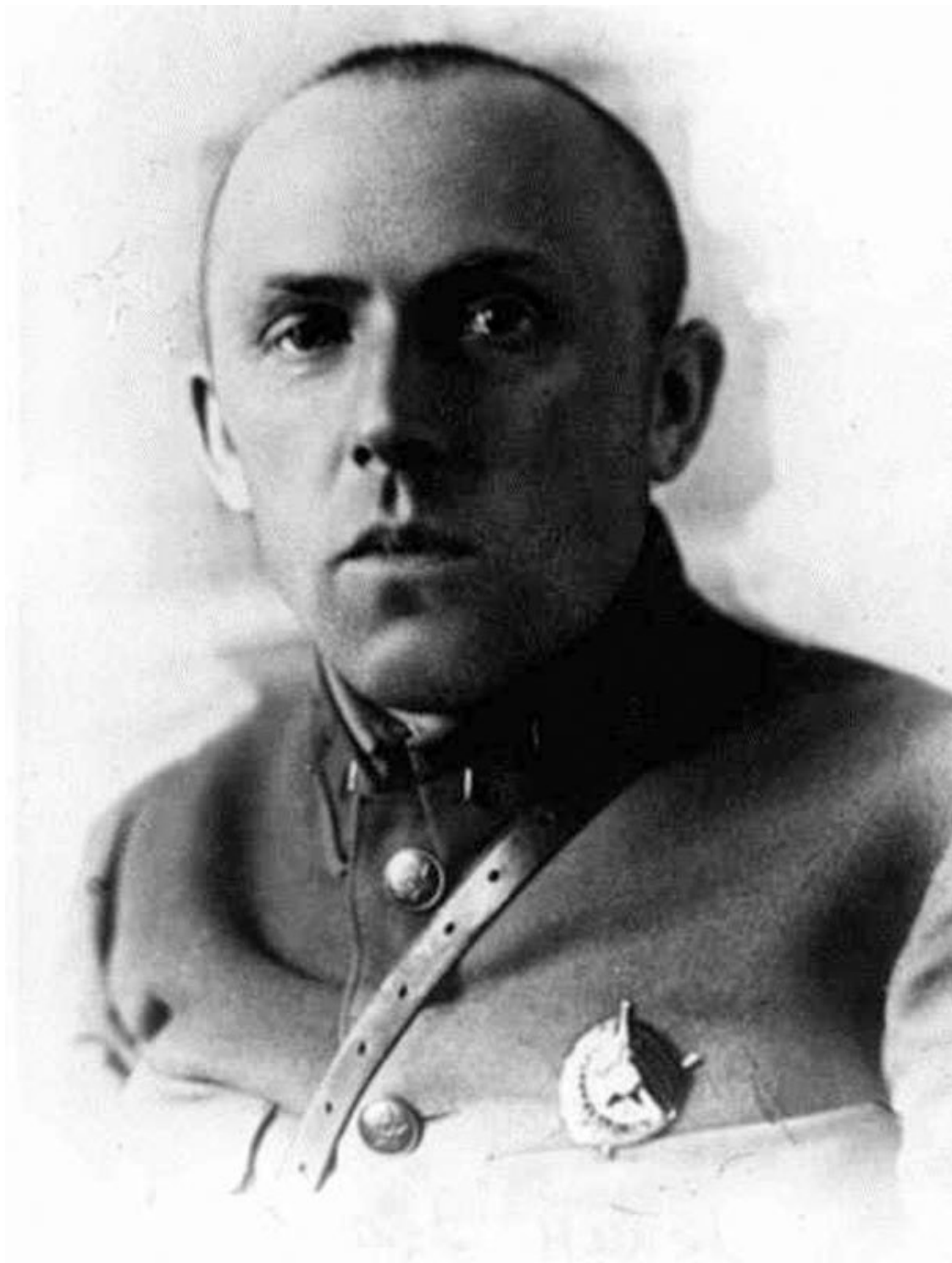
Комбриг А. В. Горбатов в середине 1930-х годов

на Западную Украину с Северного Кавказа. Вот что, провожая его, говорит нарком обороны Тимошенко: «Видимо, мы находимся в предвоенном периоде...» («Годы войны», с. 257). Вновь отметим уровень укомплектованности соединения: «я ознакомился с дивизиями. Они были полностью укомплектованы...». Как и все мемуаристы, Горбатов отмечает, что «ее (войну) ждали все, и не так уж много было среди военных людей, у которых теплилась еще надежда на то, что войны можно избежать. Однако, когда было объявлено о внезапном нападении... это сообщение всех поразило...». Надо же: «все ждали», но «всех поразило»!