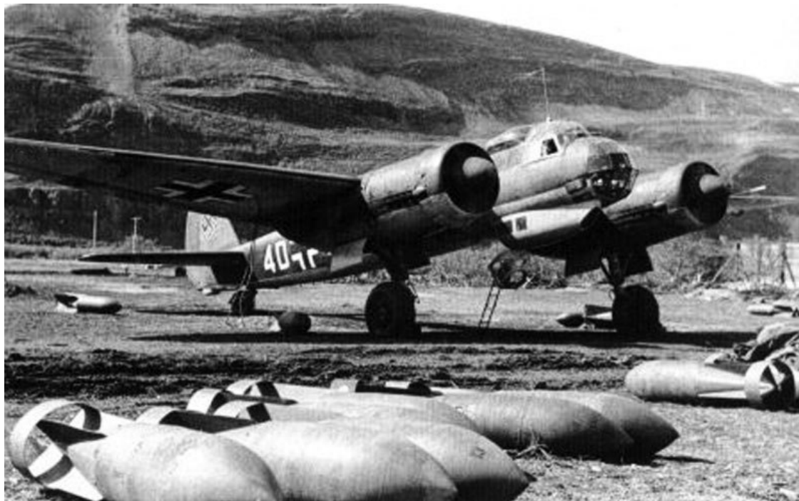
Бомбардировщик Ju-88 – самый массовый двухмоторный самолет Люфтваффе

литов, вели воздушные бои и подвергались полновесному воздействию зенитной артиллерии. О какой же внезапности может идти речь?..