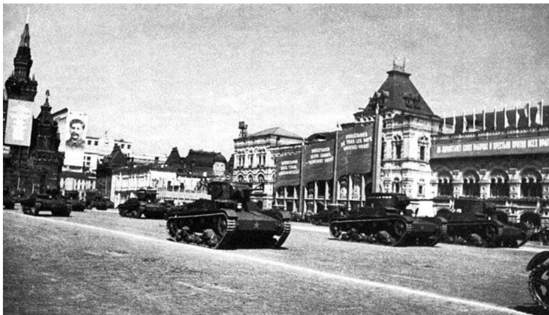
«Броня крепка и танки наши быстры...». Первомайский парад на Красной площади. 1936 год