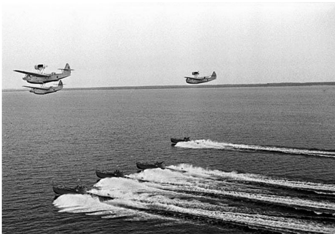
Учения торпедных катеров Черноморского флота. 1940 год