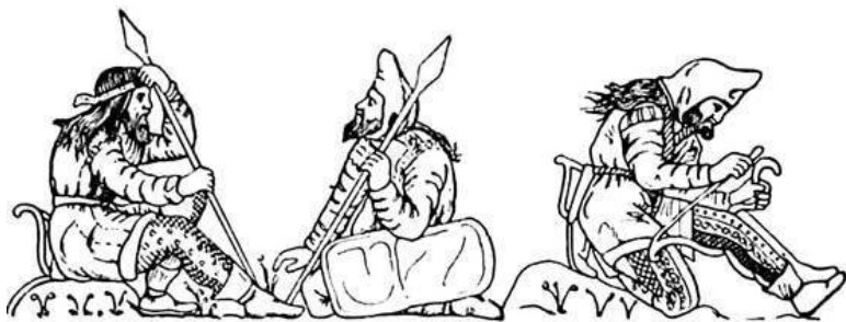
Скифские воины. Рельеф чаши из кургана Куль-Оба

ве с Германарихом в IV в.). Они воевали со славянами. Впоследствии большая часть готов под давлением гуннов переселилась на запад. Они появились в европейских степях в IV в. Гунны – это племена, пришедшие из монгольских степей, разгромившие аланов и готов. Во главе с вождем Аттилой гунны создали могучее объединение племен, в которое входили аланы, славяне, германские племена. После успешной борьбы с Римом это государство распалось, вскоре после 453 г., когда из-за интриг византийцев Аттилу коварно убили.