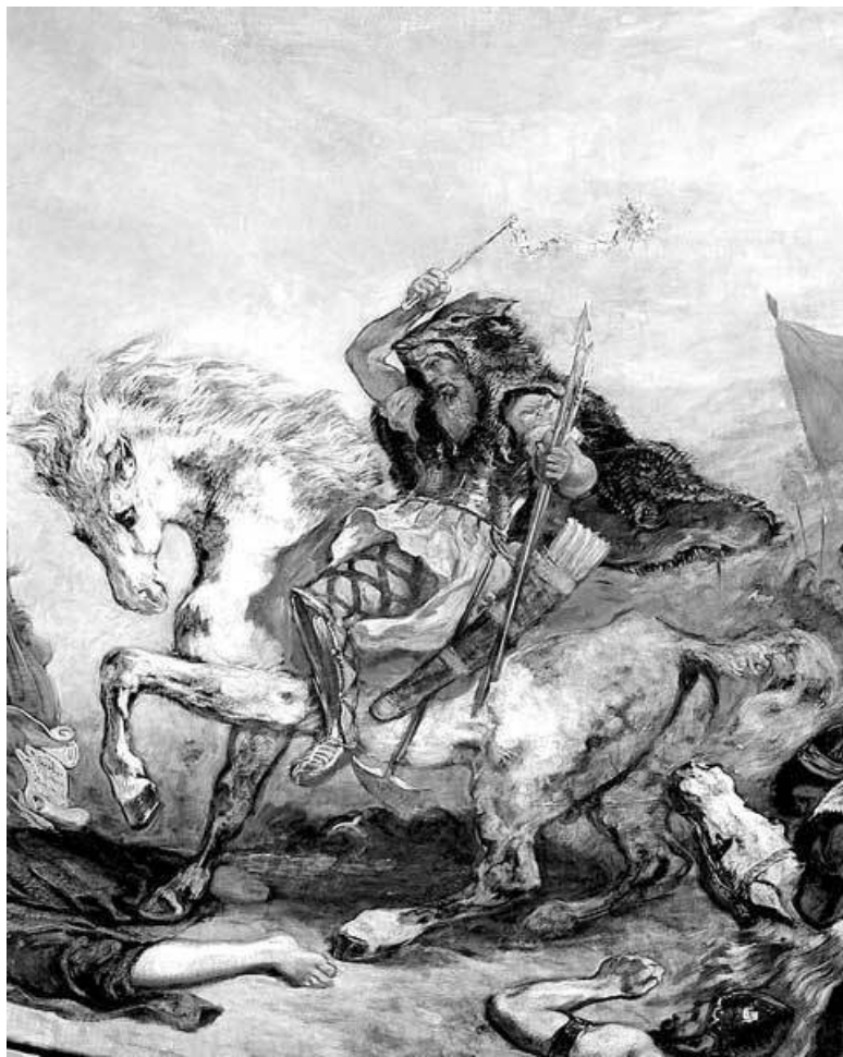
Атилла. Худ. Э. Делакруа