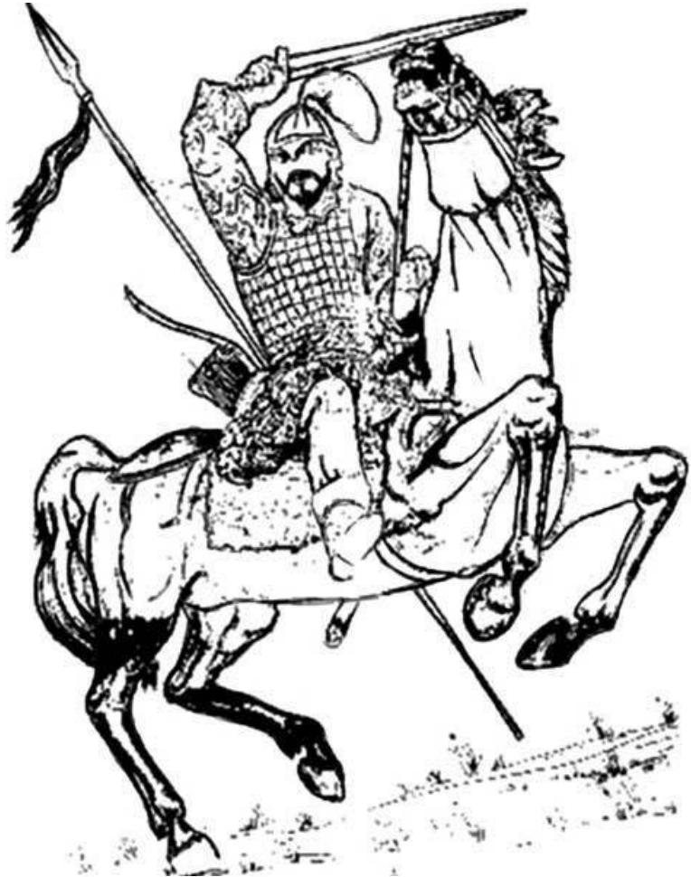
Хазарский воин. Гравюра XIX в.