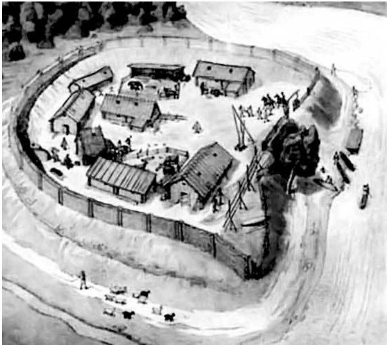
Типичное славянское городище на берегу реки (макет)

Трудно понять, какие именно давние поселения Приднепровья отразились в современных письменных источниках. Ряд исследователей пытались связать с Киевом один из приднепровских городов, названный в «Географии» Птолемея – Метрополем. Уж очень похоже на «Мать городов». Но эта популярная гипотеза не имеет основания, потому что Птолемей имел в виду город возле Ольвии. Еще более безоснова-