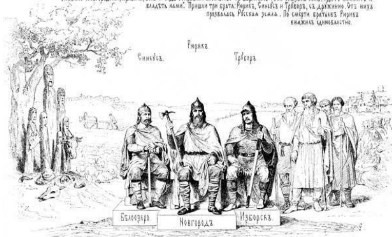
Призваніе Князей Варяжскихъ. Князь Рюрикъ.

Славяне Новгородскіе, Кривичи, Вѣсы и Чудь отдавали посольство къ Варягамъ-Руси сказавъ имъ: "идите княжить и владѣть нами". Пришли три брата: Рюрикъ, Синеусъ и Труворъ, съ дружиною. Отъ нихъ прозвалась Русская земля. По смерти братьевъ Рюрикъ княжилъ единолично.