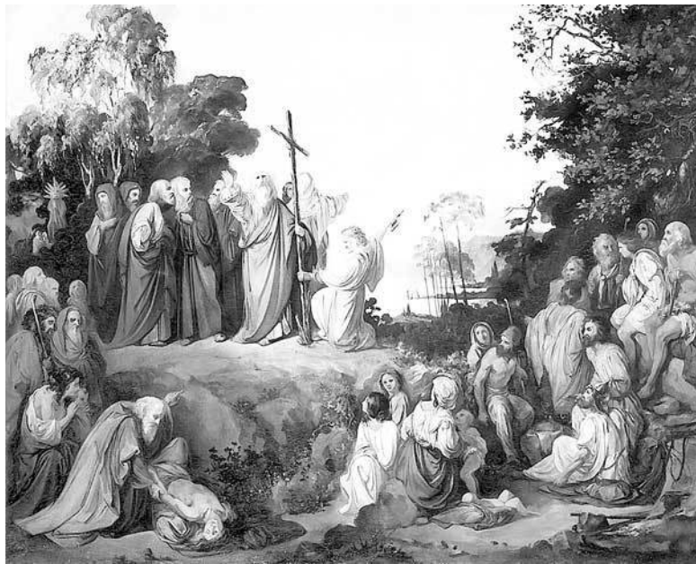
Апостол Андрей Первозванный водружает крест на горах

зантию, затем около 67 г. в Патры, в Пелопоннес, где погиб. Есть предположение, что это было при Нероне. Крест, на котором принял мученическую смерть апостол, был, по преданию, косой, как латинская буква Х. Путешествие по Руси апостол мог совершить во время своего пребывания на побережье Черного моря, то есть перед последним возвращением в Синоп. Поэтому в Сказании и нет упоминания о Константинополе, которого еще не было.