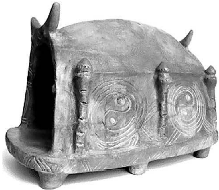
Ритуальная модель жилища. Трипольская культура

Теория Трипольской культуры, которая в последнее время поднята на щит как обоснование глубокой древности украинской нации, вполне приемлема. Много характерных особенностей быта трипольцев прослеживается в обиходе сельских жителей вплоть до начала XX в., до времени кол-