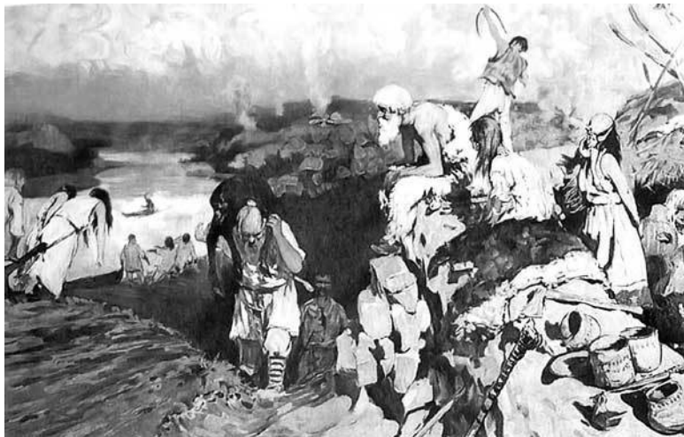
Сцена из жизни восточных славян. Худ. С. В. Иванов

Одинаково написанное слово и единство духовно-интеллектуальной традиции, конечно, рождали ощущение взаимного родства – но это только в тонком слое образованной элиты, ведь большинство ее было космополитично, принадлежало к различным культурам. Поэтому утверждать, что княжескую Русь заселяли люди, которые ощущали свою принадлежность к «единой древнерусской народности», – это то же самое, что на основе общего латиноязыкового школьничества утверждать существование «единой латинской народности» в пределах Западной Европы того времени. К сожалению, отсутствие письменных памятников языка до XI в.,