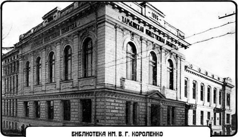
БИБЛИОТЕКА ИМ. В. Г. КОРОЛЕНКО