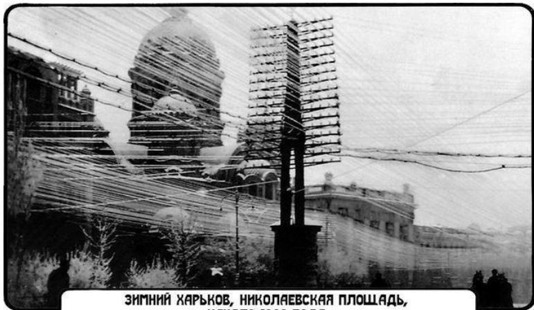
ЗИМНИЙ ХАРЬКОВ, НИКОЛАЕВСКАЯ ПЛОЩАДЬ, НАЧАЛО 1930 ГОДА

В воскресенье, 16 февраля 1930 года, Харьков весь день засыпало снегом.