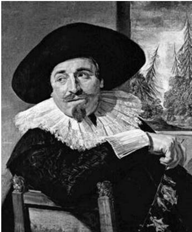
Исаак Масса. Ф Халс , 1626 г.